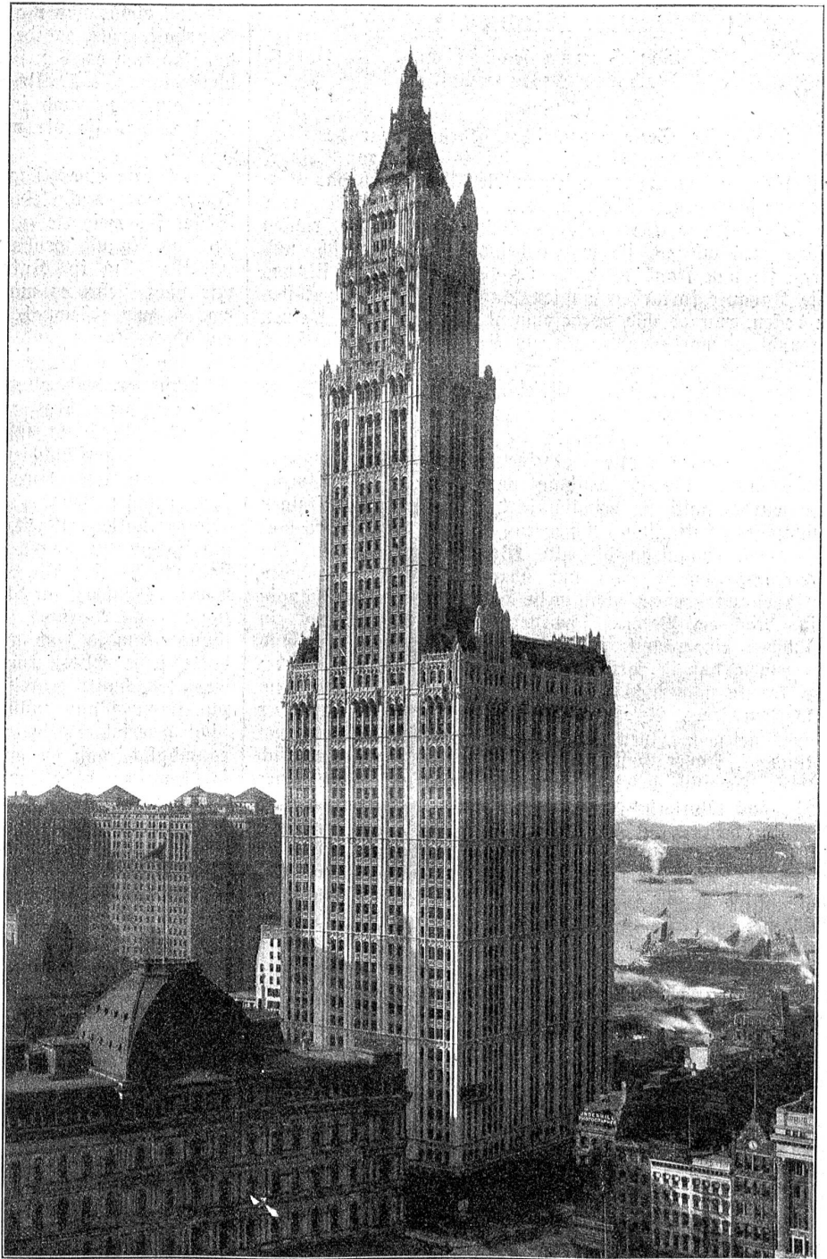
Das Woolworth-Building in New-York, erbaut 1913 von Cass Gilbert, zurzeit das höchste Haus der Welt.

Das Gebäude ist in gotischem Stil gehalten und gemahnt an eine Kirche mit Turm, der aber das Längsschiff fehlt. Bei näherer Betrachtung des Baues entdeckt man Schönheiten, die man bei andern Wolkenkratzern umsonst sucht. Den Erbauern war es sichtlich darum zu tun, nicht nur den höchsten, sondern auch den schönsten Wolkenkratzer zu errichten. Sie begnügten sich nicht bloß mit entlehnten Stilmitteln, die mit dem Wesen eines solchen Riesenhauses nichts zu schaffen haben. Der Zweckcharakter des Hochhauses ist vom Fuß bis zur Spitze gewahrt. Das zum