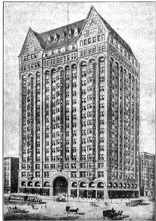
Masonic-Tempel in Chicago, der erste Wolkenkratzer, erbaut im Jahre 1890.

Es ist schwer sich vorzustellen, daß die 4½ Millionen Dollars, die der Bauplatz und die 7 Millionen Dollars, die der Bau selbst gekostet haben, einem 10 Cent-Bazar entstammen. Und doch ist es so. Die Firma Woolworth & Co. begann vor 30 Jahren mit einem einzigen kleinen Laden dieser Art, heute besitzt sie Hunderte solcher Geschäfte. Es war eine echt amerikanische Geschäftsüber-