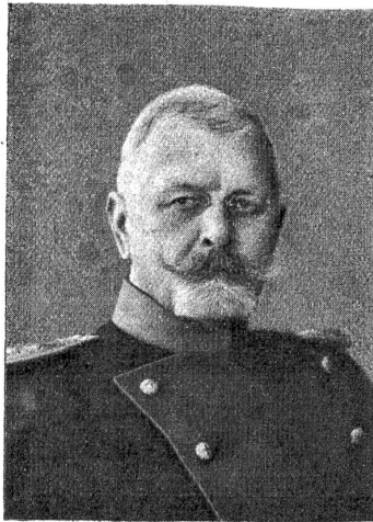
† Oberst Traugott Markwalder.

und Kommandant der Kavalleriebrigade 4, und im selben Jahre folgte die Ernennung zum Waffenschef der schweizerischen Kavallerie, welche Stelle er bis 1903 innehatte. Als Instruktor leitete Oberst Markwalder hauptsächlich die