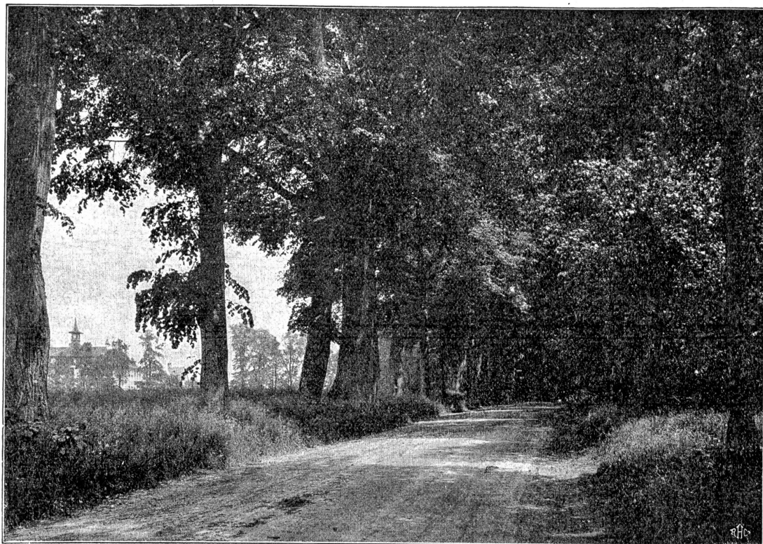
Baumallee in der Heussern Enge bei Bern.