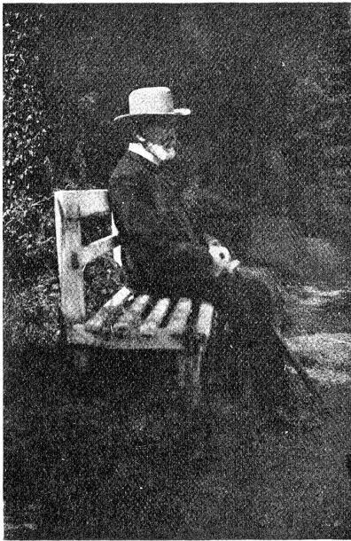
Der Vater des Dichters (Geft. im Februar 1912).

Möge es gewesen sein, daß eine bessere Kraft sich in mir regte, mag es sein, daß die neuen Lehrer mir mehr Liebe und Verständnis entgegenbrachten — meine anderthalbjährige