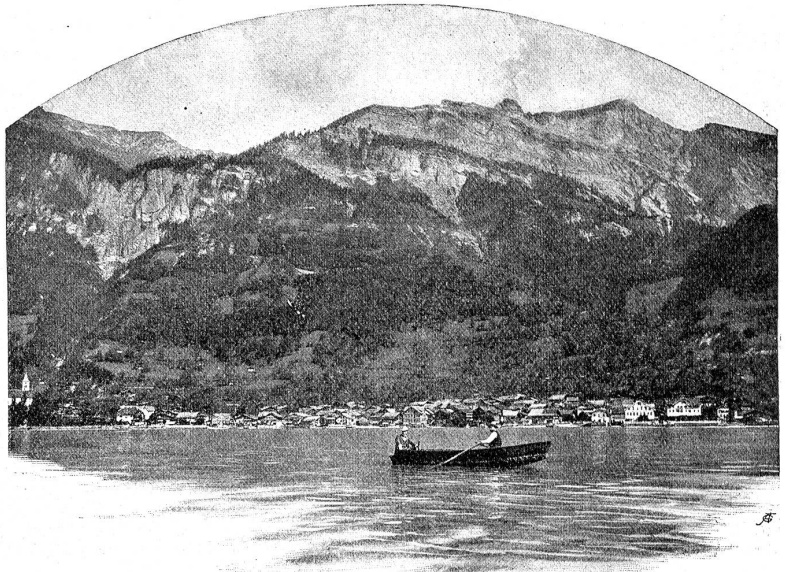
Brienz und das Brienz-Rothorn.

Wir begreifen, daß sie auf 1024 m, nach einer Höhendifferenz von 453 m in Geldried 600 Liter Wasser fassen muß.