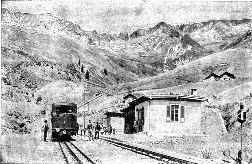
Brienzer-Rothhornbahn: Station Hausstatt (Planalp).

brauft uns das schallende Geläute. Wir schauen durchs Fenster, dort, hoch oben weilen die Kühe. Wir werden bald in ihrer Nähe sein. Wir passieren eine Eisenbrücke, die uns sicher über eine graufige Schlucht geleitet, wo vor zwei Jahren die erstgebaute durch den Luftdruck einer Schneelawine zertrümmert wurde. Armselige Hütten, niedere Kuhställe und typische Heuschuppen lassen wir vorübergleiten.