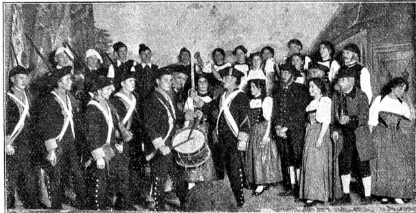
„Bärewirts Töchterli“, IV. Akt, Schlußbild.

voraus. Denn Grunder stammt aus bäuerlicher Familie; er wuchs mitten in einer Umgebung auf, in der die Kraft und Originalität des Emmenthaler Dialektes noch unverfälscht und ungechwächt fortlebt. Von seinem eigenen Vater erlauchtete er jene altertümlichen Weisen, diese stimmungsvollen Volks-