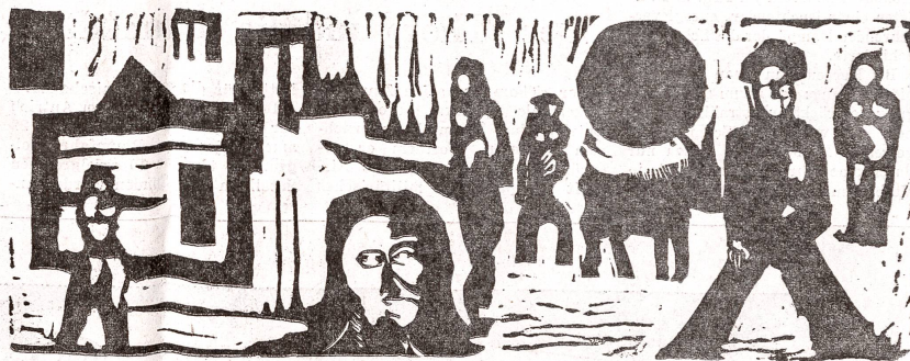
Pieter Ott: «Komposition», 1957. Das Schwarz-weiß-Blatt bringt in kraftvoller und scharf abgegrenzter Kontur das Nebeneinander des Geschehens im täglichen Leben, gewissermaßen als Spiegelbild, eindringlich und nachhaltig zum Ausdruck.

Gebäudeversicherung: Von 3389 (3572) Gebäudeschätzungen entfielen 2017 (2186) auf Schätzungen im Revisionsverfahren und 1372 (1386) auf Einzelschätzungen, wovon 436 (645) durch Neubauten bedingt. 249 (263) Gebäude wurden infolge Abtragung abgeschrieben. Der Prämienbetrag betrug unverändert 55 Rappen vom Tausend der Versiche-