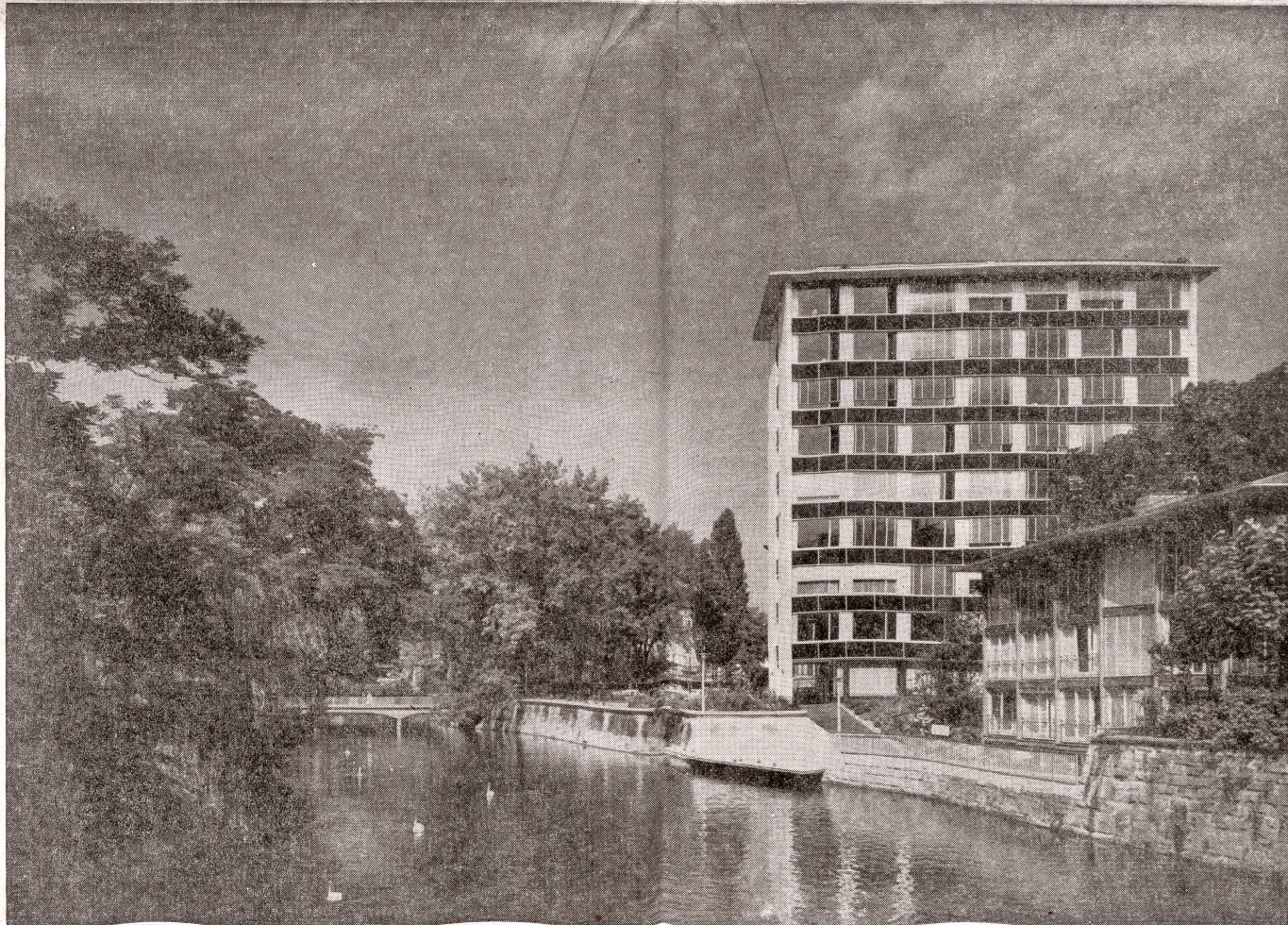
Auszeichnung guter Bauten der Stadt Zürich: Am Schanzengraben: Geschäftshaus «Bastei» der AG Heintz Matt-Haller; Architekt: Werner Stücheli

Was die Glasbauten betrifft, so haben wir uns hier vor einem Jahr