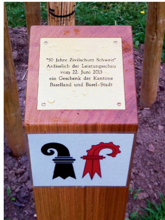
Zur Feier des 50-Jahr-Jubiläums des Schweizer Zivilschutzes wurden 2013 in der ganzen Schweiz Bäume gepflanzt.

Um die gemeinsame Arbeit zum Schutz der Bevölkerung zu betonen, pflanzten die Herren Regierungsräte Dürr und Reber einen Baum. «Ein Symbol für die wachsende Zusammenarbeit», sagte Reber, «und für die Nachhaltigkeit des Zivilschutzes, der fest verwurzelt ist in unserer Gesellschaft.»