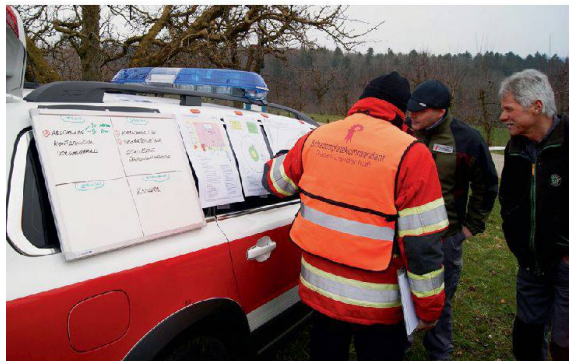
Absprachen zwischen Schadenplatzkommandant, Veterinär und Hofbesitzer.

Über eine Woche übten der Kantonale Krisenstab, zwei Regionale Krisenstäbe, die ABC-Wehr Baselland, drei Zivilschutzkompanien und eine Veterinärkompanie der Armee die Bekämpfung der hoch ansteckenden Maul- und Klauenseuche im Oberbaselbiet. Auf drei landwirtschaftlichen Betrieben mit Kühen wurden die Ställe komplett geleert, entseucht, desinfiziert und damit «entgiftet».