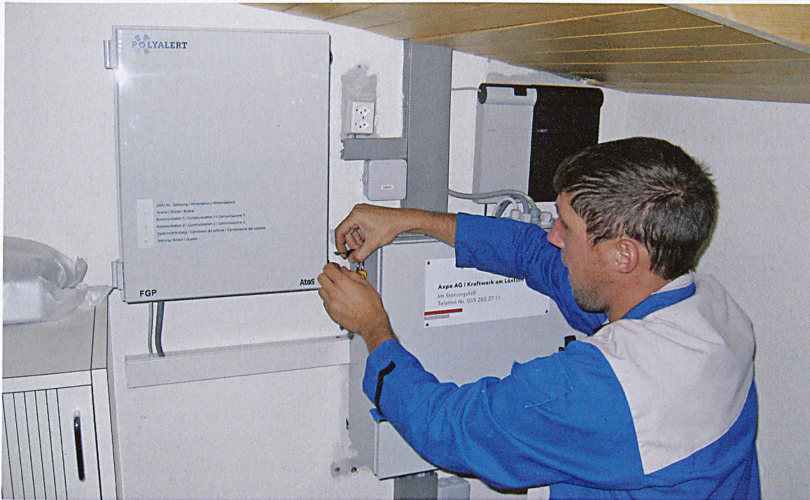
Ein Installateur schliesst ein neues POLYALERT-Fernsteuerungsgerät an. Der Empfang ist an diesem Standort gut genug, so dass keine zusätzlichen Antennen nötig sind.

lateuren gab es zuerst einige Probleme bei Terminvereinbarungen; dies wurde aber korrigiert und auch die Installateure machten ihren Job sehr gut.»