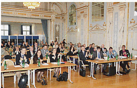
Die internationale Kulturgüterschutztagung wurde von rund 60 Gästen aus dem In- und Ausland aufmerksam verfolgt.

Dass Kulturgüter auch heute noch in bewaffneten Konflikten gefährdet sind, haben aktuell die Zerstörungen an den Weltkulturerbe-Stätten in Timbuktu (Mali) oder Aleppo (Syrien) gezeigt. An der internationalen Tagung, die unter dem Patronat der UNESCO durchgeführt wurde, betonten die Teilnehmenden, dass bedeutende Kulturgüter vermehrt unter den sogenannten «verstärkten Schutz» gestellt werden sollen. Zudem seien die Zusammenarbeit mit dem Internationalen Komitee des Roten Kreuzes IKRK und Nichtregierungsorganisationen zu fördern und die strafrechtliche Verfolgung von Tätern, die Kulturgut zerstören, konsequent umzusetzen.