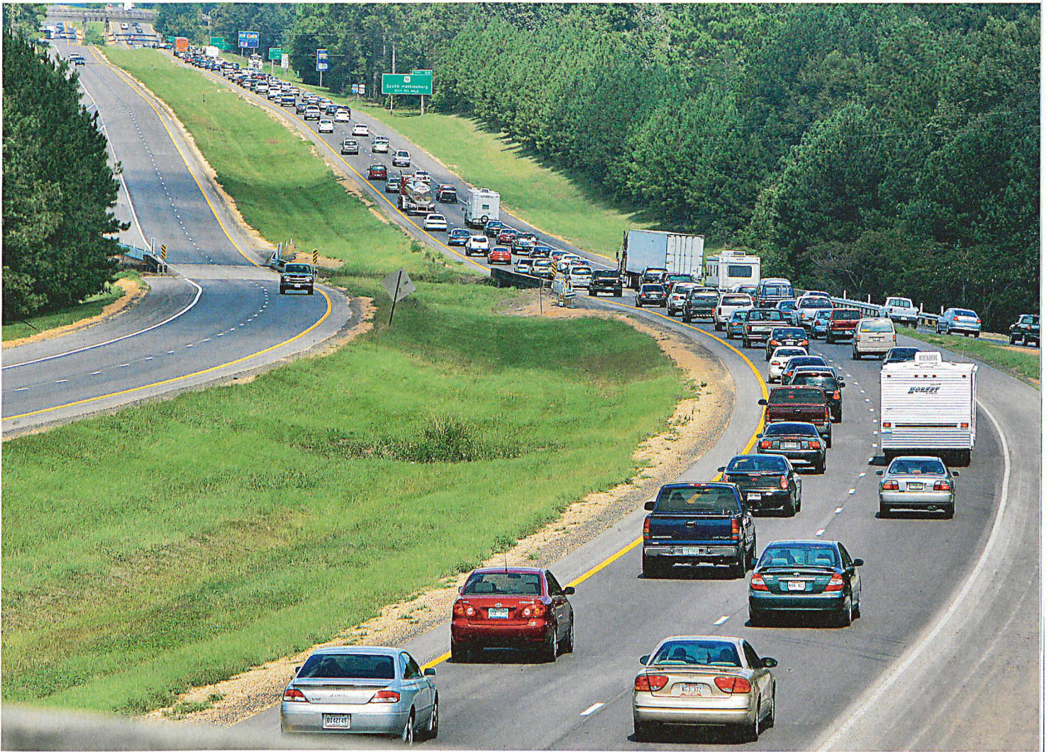
Ein Grossteil der Bevölkerung kann sich erfahrungsgemäss selbstständig aus dem Evakuierungsgebiet begeben. Im Bild: Bewohner der US-Südstaaten ziehen in Kolonnen vom Golf von Mexiko nordwärts und bringen sich in Sicherheit vor dem Hurrikan Katrina.