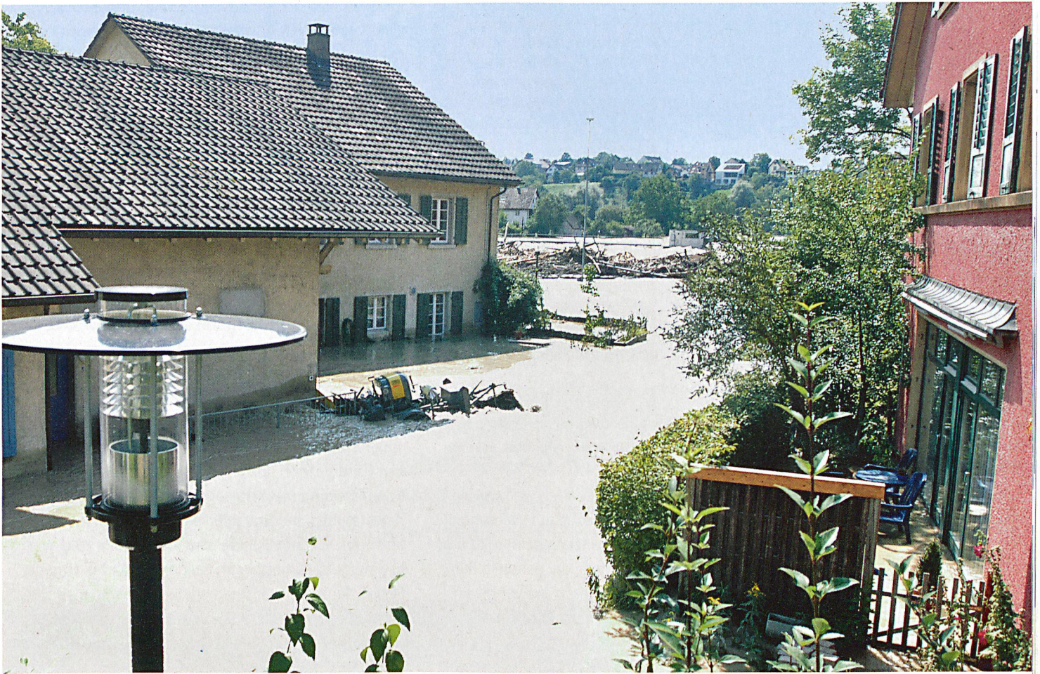
Nach den Hochwassern von 2005 wurde angestrebt, ein einheitliches Warnsystem zu etablieren, um für die Bevölkerung eine präzise Unwetterwarnung, insbesondere bei Hochwassern und Stürmen zu gewährleisten.

ren Bild der aktuellen Situation und zu Unsicherheit über das richtige Verhalten führen. Im Nachgang zu den Hochwassern 2005 kam deshalb auch in den eidgenössischen Räten die Forderung auf, ein einheitliches Warnsystem zu etablieren, das «eine präzise Unwetterwarnung der Bevölkerung, insbesondere bei Hochwassern und Stürmen» gewährleistet.