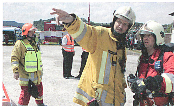
110 000 Feuerwehrleute stehen in der Schweiz für Rettung und allgemeine Schadenwehr zur Verfügung.

Der Zivilschutz ist in nahezu idealtypischer Weise und in fast vollständigem Umfang eine Milizorganisation: Praktisch der gesamte Bestand der heute im Zivilschutz eingeteilten rund 80 000 Personen sind Milizpersonen. Mit Blick auf die von ihnen wahrgenommenen anspruchsvollen Aufgaben in den Bereichen Logistik, Alarmierung, Führungsunterstützung, Betreuung, Kulturgüterschutz, Instandstellung etc. ist ihre Ausbildungszeit relativ kurz bemessen. Der Zivilschutz baut also darauf, dass die Angehörigen Kompetenzen und Qualifikationen aus ihrem beruflichen und persönlichen Umfeld mitbringen. Im Zivilschutz werden somit vorhandene Ressourcen für das Gesamtsystem Bevölkerungsschutz nutzbar gemacht – auch dies ein typisches Strukturmerkmal des Milizsystems.