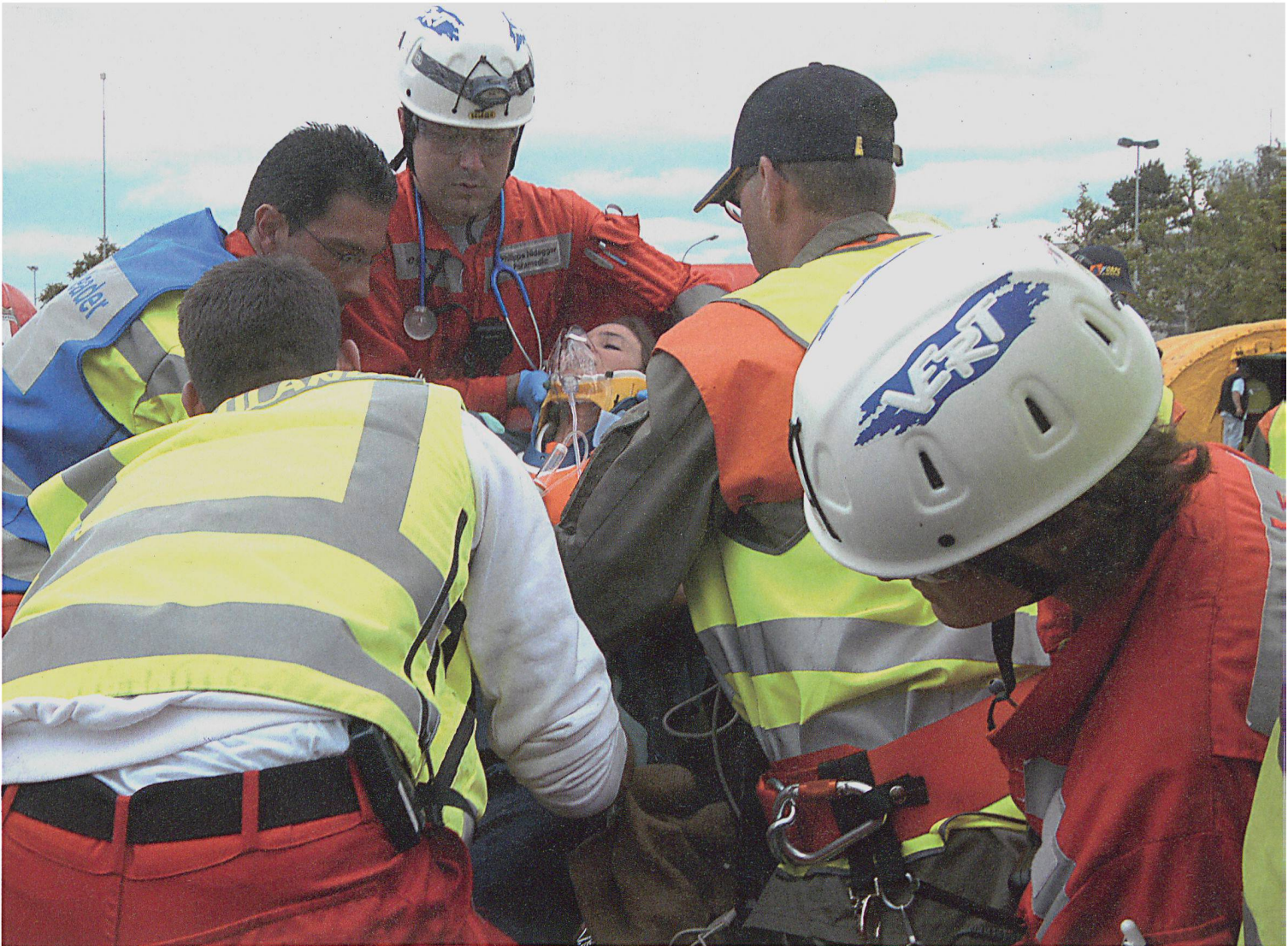
Zur Bewältigung von Katastrophen und Notlagen arbeiten die Partnerorganisationen eng zusammen.

Die Bereitschaft von Unternehmen, Mitarbeiterinnen und Mitarbeiter für öffentliche Aufgaben freizustellen, ist klar rückläufig. Die zunehmende Individualisierung, das sich wandelnde Freizeitverhalten, der ausgeprägte Wertpluralismus einer modernen Gesellschaft – all dies wirkt sich tendenziell nachteilig aus auf jegliches öffentliche Engagement und damit auf das Milizprinzip. Vor diesem Hintergrund wird auch in der Schweiz