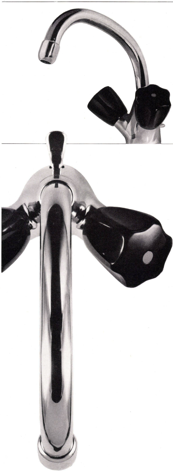
Einloch-Waschtischbatterie Nr. 3072 mit schwenkbarem Auslauf und Ablaufventil