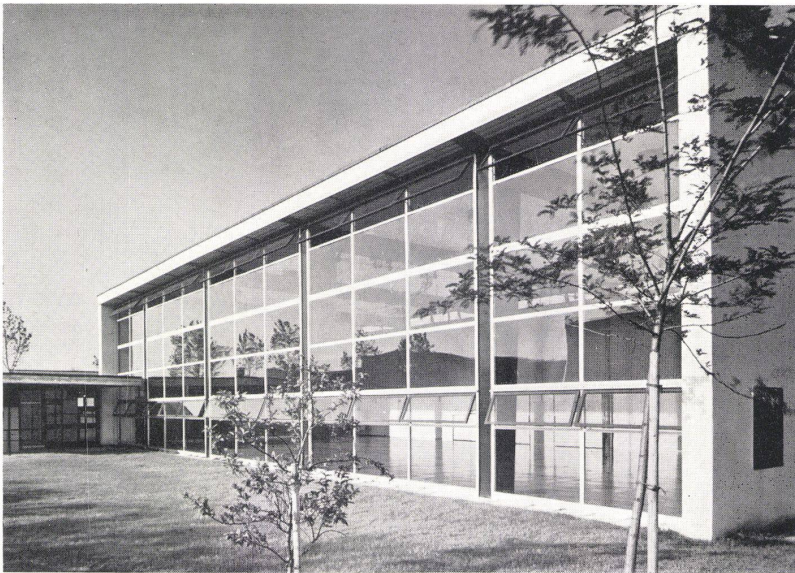
Turnhalle Wasgenring, Basel