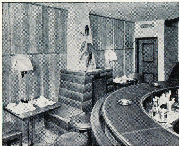
Die bekannte Schiffplänkebar in Zürich