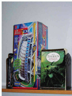
Bibliothèque d'ado incluant le Prix Wrebbitt d'architecture