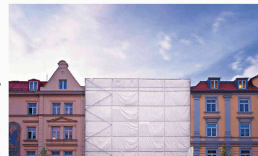
Saint-Gobain ISOVER Route de Payerne, CP 11 CH - 1522 Lucens < www.isover.ch >

Les bâtisseurs sont toujours plus nombreux à utiliser des composants certifiés Minergie dans l'assainissement des anciens édifices. Pour les aider dans leur démarche, Saint-Gobain Isover SA a édité une brochure sur la rénovation. On y trouve notamment des schémas détaillés avant/après permettant de quantifier, pour chaque élément de construction, les économies d'énergie réalisables grâce à Minergie .