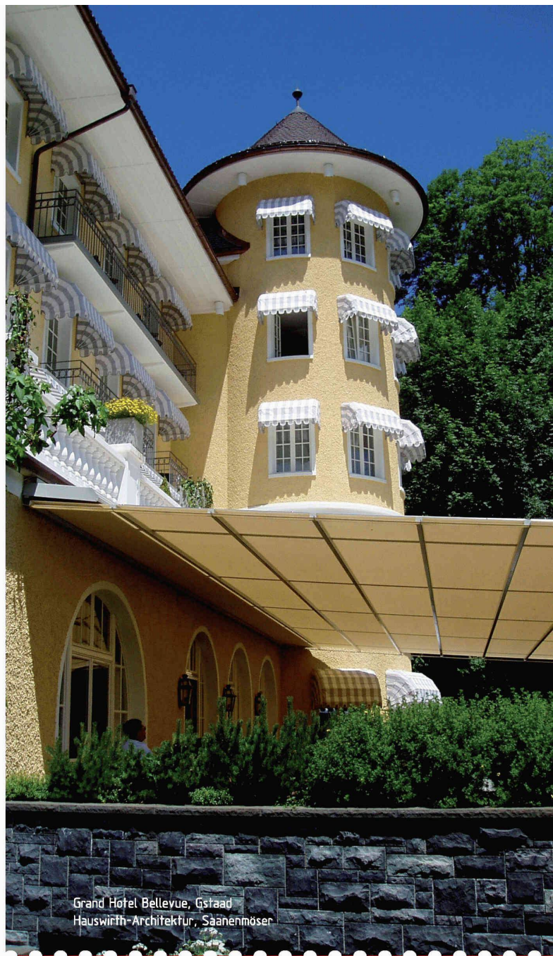
Grand Hotel Bellevue, Gstaad Hauswirth-Architektur, Saanenmöser

TULUX LUMIÈRE SA LICHT.LUMIÈRE EN SEGRIN 1 CH-2016 CORTAILLOD TÉLÉPHONE +41 (0)32 841 47 01 TÉLÉFAX +41 (0)32 842 45 16 WWW.TULUX.CH