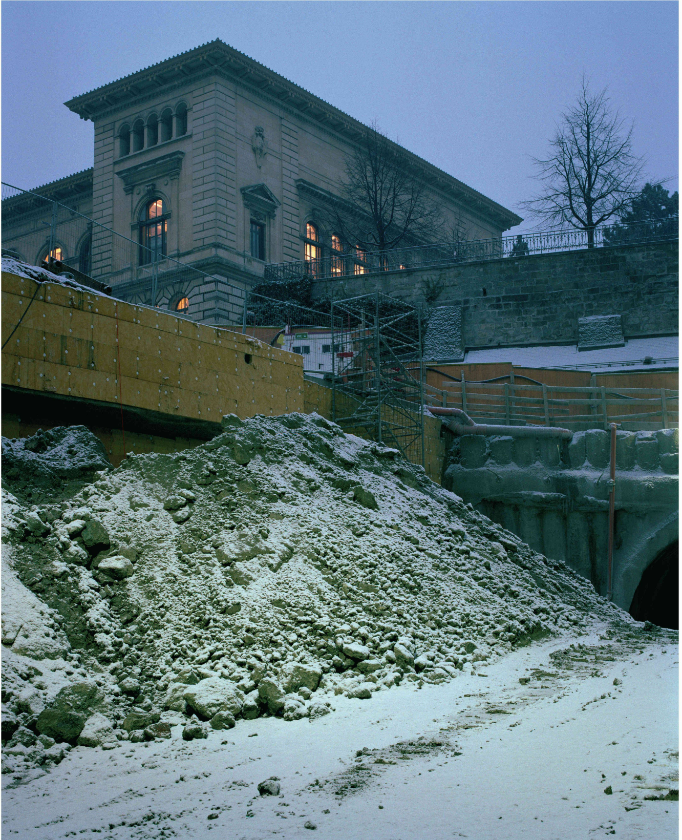
Fig. 3 : Entrée du tunnel Viret, 16 janvier 2006