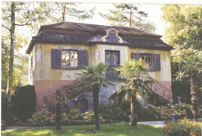
Fig. 1 : Le Löwenhof de Rheineck (le pavillon)