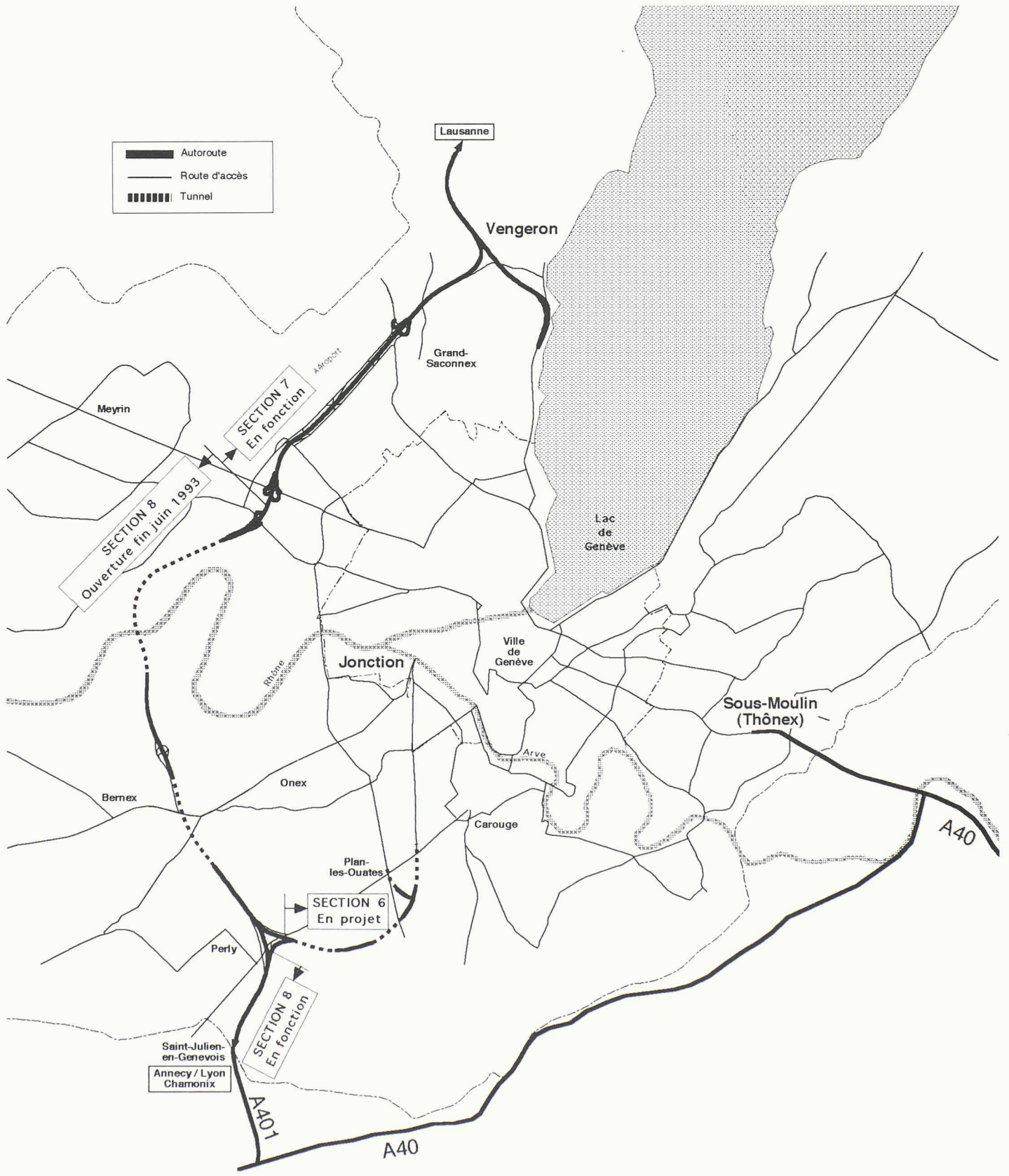
Fig. 1. - Autoroute de contournement de Genève: plan général