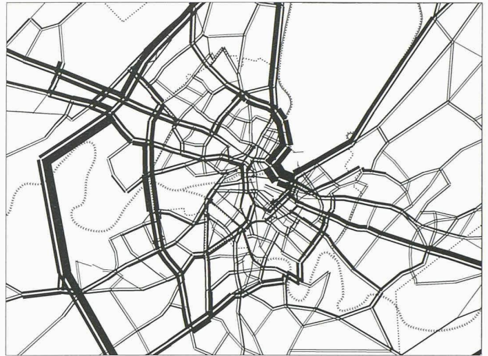
Fig. 3. — Exemples de projection de trafic: sur le réseau routier sans l'autoroute de contournement (gauche) et avec l'autoroute de contournement et quelques mesures d'accompagnement au centre-ville (droite)

chaque itinéraire au départ de l'échangeur du Vengeron.