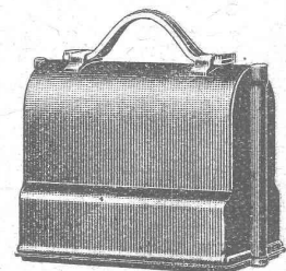
Niveau emballé, 1/6 grandeur naturelle

S. A. Henri Wild - Heerbrugg Téléphone 95 (St-Gall)