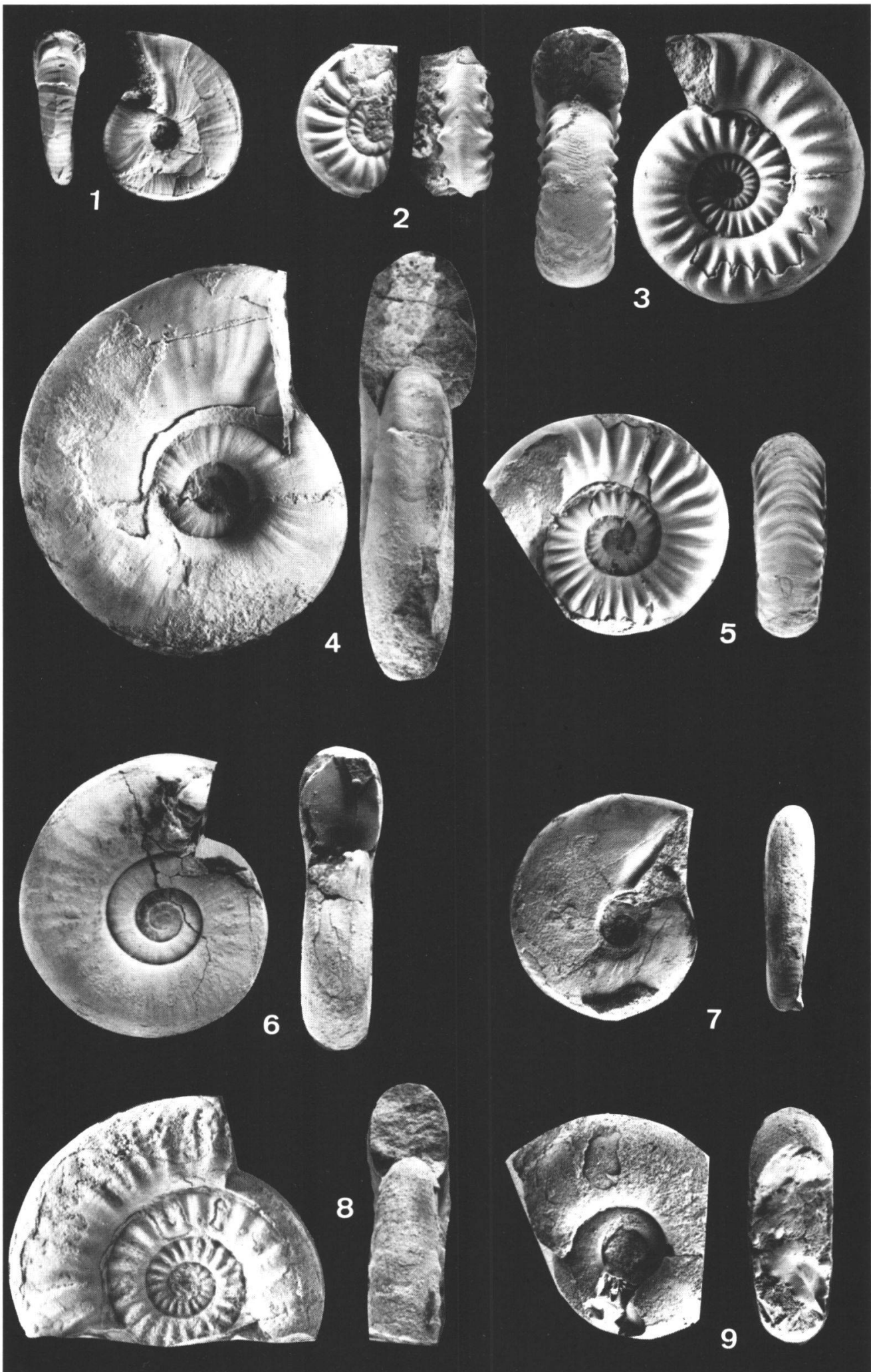
Légendes au verso de la planche I