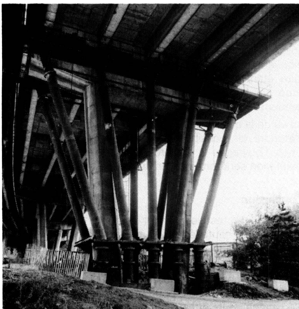
Fig. 1 Montage des palées au droit d'une pile

Afin de ne pas gêner la circulation tout en laissant le temps nécessaire à la réfection des bossages et des abouts de poutre, il a été convenu de vérifier les deux