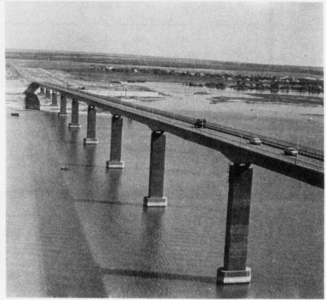
Fig. 1 The general view of the bridge

The river pier foundations are mounted on bored piles d = 1.35 m. One form was used for concreting massive solid piers above the pilework, irrespective of their heights. The approach viaduct piers are precast and cast-in-place and erected on natural foundation.