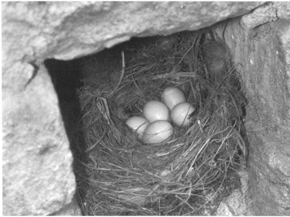
Fig. 7. A l'Amphithéâtre, certains trous de boulin servent de nichoir aux pigeons. Cette population envahissante et polluante dégrade le monument.

mandatée par le Service des Bâtiments. Elle a pris cette année quelques premières mesures, comme la pose de filets devant certaines fenêtres du Musée. S. Bigović a contribué pour sa part en obturant par un moellon scellé en retrait la plupart des trous de boulin accessibles qui servent de perchoir ou de nichoir aux funestes et malpropres volatiles (fig. 7). Ce fut aussi l'occasion d'éradiquer la végétation ligneuse qui s'était développée dans les anfractuosités des murs, et d'en traiter les racines pour éviter toute repousse (fig. 8). D'autres mesures sont attendues, comme la pose de pics sur certaines corniches ou plus simplement quelques séances bienvenues de tir aux pigeons.