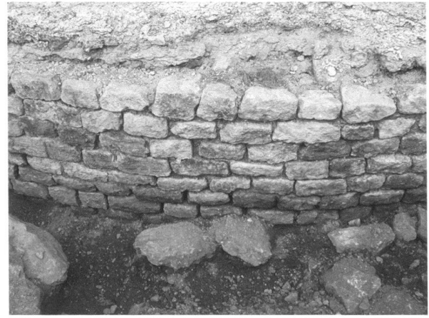
Fig. 2a et b. Les Thermes de Perruet. Le mur de l'abside du frigidarium, dans son premier état, avant et après restauration.

reviendra également, dans les meilleurs délais, d'assurer l'entretien du secteur adjacent du mur d'enceinte, restauré dans les années 1910-1920.