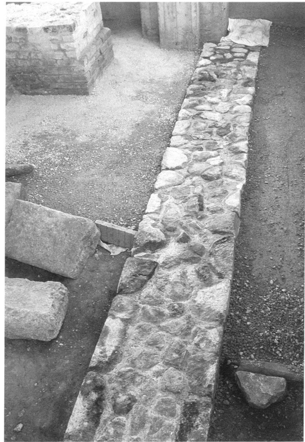
Fig. 1a et b. Les Thermes de Perruet. Le mur flanquant à l'est le frigidarium, secteur nord vu du nord avant restauration et du sud après celle-ci.