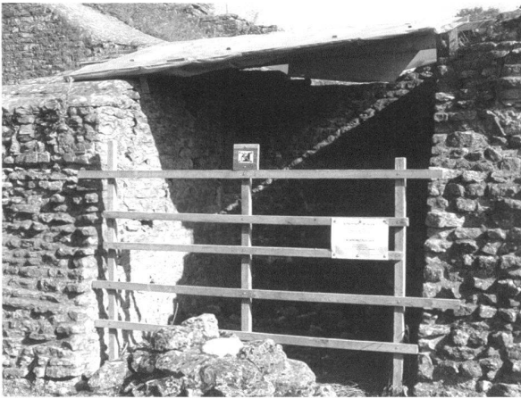
Fig. 4. Le Théâtre. Un secteur clôturé et protégé des intempéries : le parement du contrefort M 22, à gauche, s'est décollé et menace de s'effondrer.

La lutte s'est poursuivie contre le développement de la végétation ligneuse aux dépens des maçonneries antiques.