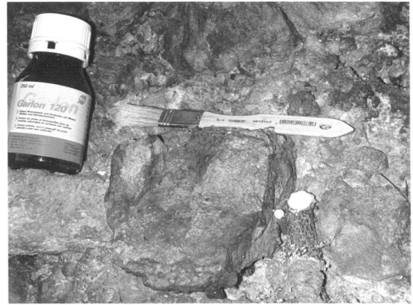
Fig. 8. A l'Amphithéâtre, traitement des racines résiduelles d'un buisson parasite des murs.

Dans la cavea sud, la remise en état du talus herbeux mis à mal par les modifications apportées aux fondations des gradins provisoires a nécessité d'importants travaux, pris en