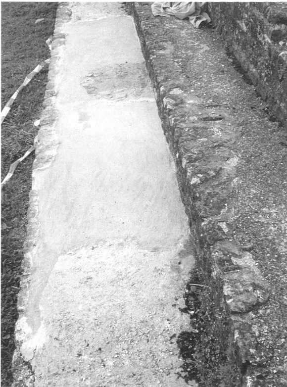
Fig. 5. Portique nord-est du Cigognier : remplacement de la chape du gradin inférieur.

Au Cigognier , il a été procédé aux habituels travaux d'entretien des chapes et du jointoiment des parements ; une fois de plus, pour des raisons encore peu claires, le mortier recouvrant le gradin inférieur du portique nord-est s'était dégradé sur une importante surface : il a donc fallu le remplacer en utilisant localement, outre les composants habituels, et à titre d'essai, du ciment à haute teneur en silice additionné de poudre volcanique (type Trass) en lieu et place du ciment blanc (fig. 5).