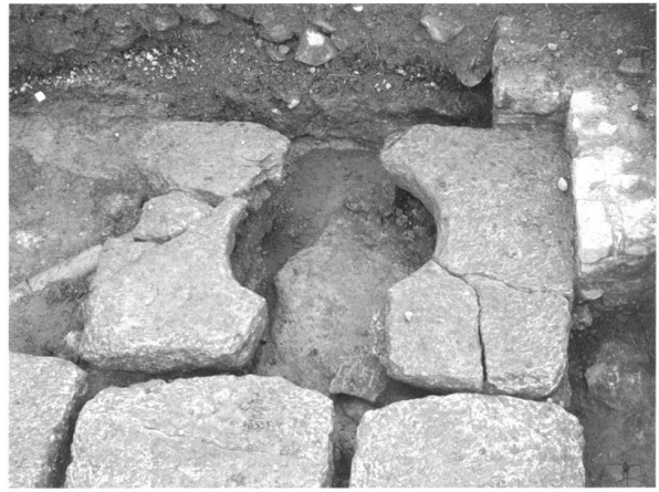
Fig. 6. Temple de la Grange-des-Dîmes . Les blocs en grès de la margelle du puits avant prélèvement.

Au Mur d'enceinte , en dépit de nouveaux débroussaillages et d'un bon entretien des abords par les services communaux, la dégradation des tronçons restaurés au début du siècle passé se poursuit. C'est le cas en particulier des parements internes et externes des courtines jouxtant la Tornallaz : quelques moellons sont déjà tombés et un rejointoiment s'impose d'urgence. La Commune, propriétaire de l'édifice, a été alarmée et un descriptif des travaux à entreprendre a été dressé, qui devrait lui permettre de faire établir un devis, puis d'adjudger ces travaux, à réaliser dès 2006 si l'on veut éviter des dégâts plus importants et des coûts de remise en état multipliés.