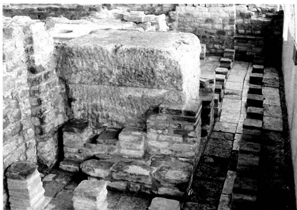
Fig. 3. Les Thermes de Pernet, caldarium. Fondation du pilier sud avec le muret de doublage calorifuge. Reconstruction au mortier de chaux teinté, imitant le mortier d'argile romain.

Une autre intervention sur le caldarium , réalisée par M. Kaufmann, a concerné le muret de calorifugeage doublant la fondation en grand appareil de molière du pilier sud. Ces modestes vestiges sont un important témoin pour la compréhension des étapes de construction et de réparation de l'installation de chauffage de cette salle. Ce muret formé de carreaux de terre cuite fut à l'origine monté avec de l'argile en guise de mortier, si l'on en croit la documentation des premières fouilles. Une première restauration/reconstruction fut réalisée avec le même liant par H. Weber en 1997, mais les conditions climatiques très défavorables qui règnent à cet emplacement (humidité permanente en sous-sol et gel hivernal) ont gravement compromis cette réalisation expérimentale. Dès le premier hiver, la maçonnerie s'était détachée de 2 à 3 cm des fondations du pilier. Après quelques années de rémission, les premières dallettes de terre cuite se sont déchaussées et le muret s'est affaissé. En été 2002, M. Kaufmann a procédé à son démontage très soigneux, puis à sa reconstruction, exacte au centimètre près. C'est à un mortier de chaux légèrement chargé de ciment blanc qu'on a eu cette fois recours; pour lui donner un aspect proche du mortier d'argile original soumis au feu, il a été teinté, pour les parties visibles, à l'aide de pigments minéraux (fig. 3).