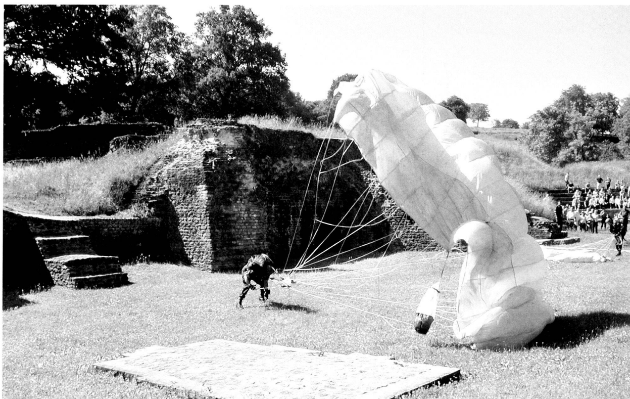
Fig. 8. Un éclaireur-parachutiste se pose au théâtre antique.

Les monuments d' Aventicum , accueillant chaque année spectacles et manifestations diverses, contribuent à la renommée du site que de nombreux touristes reviendront visiter. Leur entretien mérite d'être assuré au mieux : les crédits et le personnel nécessaires à ces travaux doivent être impérativement garantis, particulièrement ces prochaines années où la plupart des restaurations anciennes, atteignant l'âge canonique de centenaires, devront faire l'objet d'assainissements lourds. Ce sera l'occasion d'en compléter l'étude scientifique pour mieux les présenter au public. Une première tentative en ce sens a été faite à l'occasion des Journées européennes du patrimoine, durant lesquelles l'amphithéâtre, la porte de l'est et les thermes de Perruet ont été commentés par des archéologues et des restaurateurs.