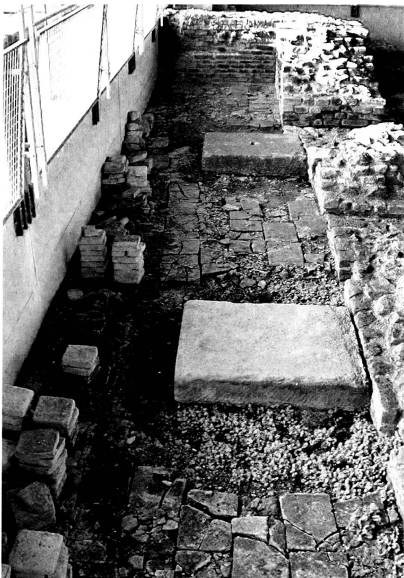
Fig. 1. Les Thermes de Perruet. Etat du sol du caldarium avant la restauration.

Aux Thermes de Perruet ( insula 29), le programme de restauration s'est poursuivi sous la responsabilité de M. Kaufmann. L' area de la partie dégagée du caldarium a subi le même traitement que celui appliqué au sol du tepidarium en 2001. Depuis sa mise au jour lors des fouilles des années 1950, le sol en carreaux de terre cuite, déjà gravement endommagé lors du fonctionnement du dispositif de chauffage dans l'antiquité, s'est dégradé sous l'effet du gel, de manière irréparable pour 60% des éléments qui ont dû être remplacés par des répliques en ciment teinté (fig. 1).