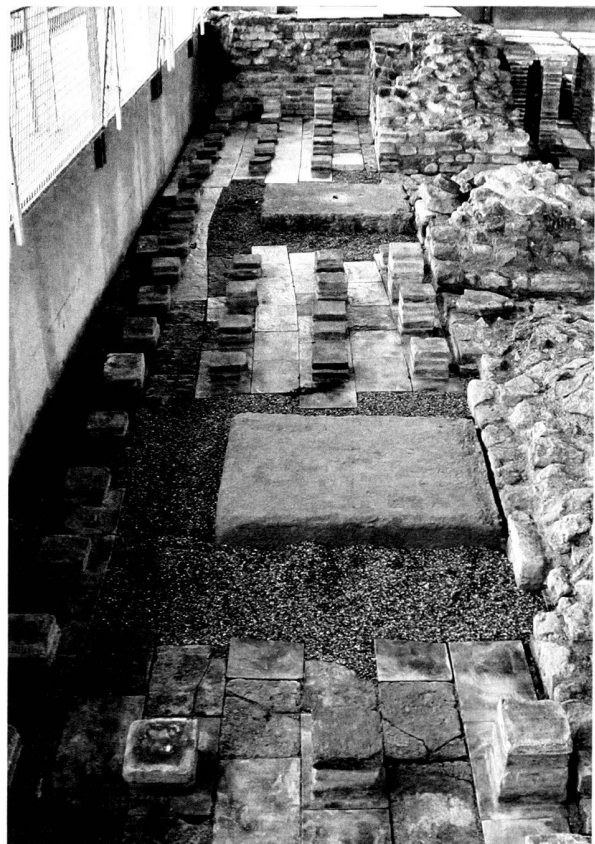
Fig. 2. Les Thermes de Perruet. Le sol restauré du caldarium.

La reconstruction à leur emplacement d'origine des pilettes qui supportaient le sol de circulation fut un casse-tête, en l'absence de relevés exacts et complets du dispositif lors de sa première mise au jour. Le problème est encore compliqué par le fait que le plan même de ce secteur du caldarium a imposé par deux fois, et dès l'antiquité, un