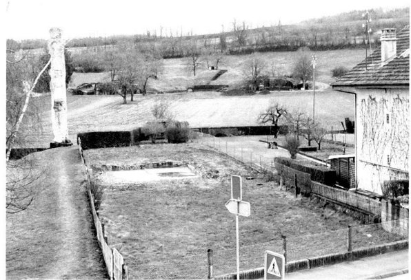
Fig. 5. Vue de l'emplacement du podium du temple du Cigognier après démolition de la maison Ryser. Au fond, le théâtre.

En collaboration avec Aventicum Opéra et en bonne partie aux frais de cette Association, les équipements techniques ont été améliorés: financée en partie par le Fonds d'entretien et d'amélioration des installations, qui est alimenté par les taxes d'utilisation réclamées aux organisateurs de manifestations, une ligne d'alimentation électrique enterrée a été posée, desservant l'angle sud-ouest du Rafour; les barrières existant en limite est de la cavea et en bordure de la terrasse orientale ont été modifiées pour les rendre aisément démontables lors de spectacles dont le dispositif scénique empiète sur ces secteurs.