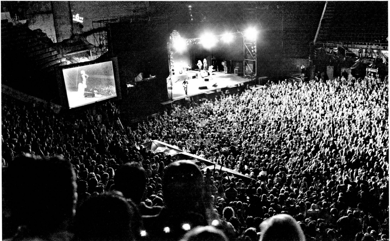
Fig. 6. Joe Cocker en concert sur la grande scène de Rock Oz'arènes.

La signalisation touristique devrait s'enrichir sous peu de deux panneaux prévus en Gare CFF d'Avenches, l'un pour accueillir les passagers débarquant sur le quai et les renseigner sur les itinéraires de visite du site, l'autre disposé au nord des voies et à bonne hauteur pour attirer l'attention des voyageurs de passage sur le tronçon bien visible du mur d'enceinte. Soumis au début de l'année aux services techniques des CFF pour approbation, ce projet a pris quelque retard en raison des travaux de transformation des installations et bâtiments de la gare, programmés pour février 2003, dans lequel il devra s'intégrer au prix de quelques adaptations.