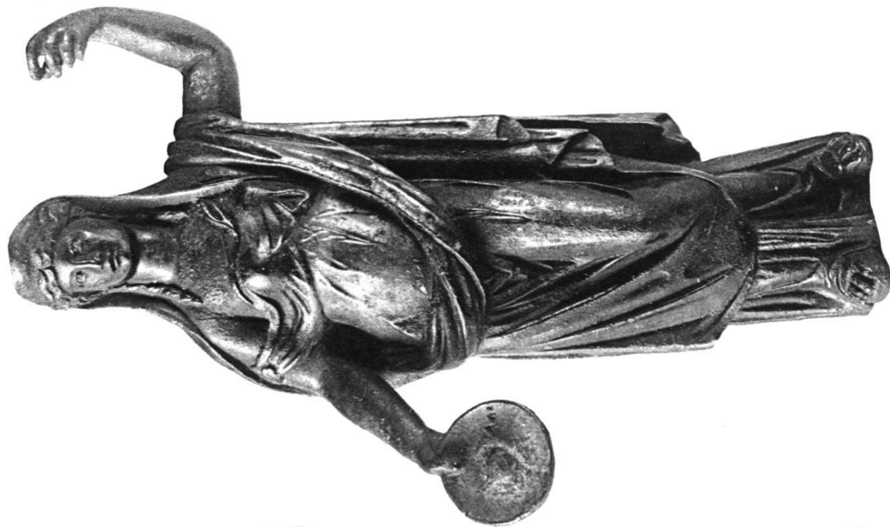
1. Junon (Avenches)