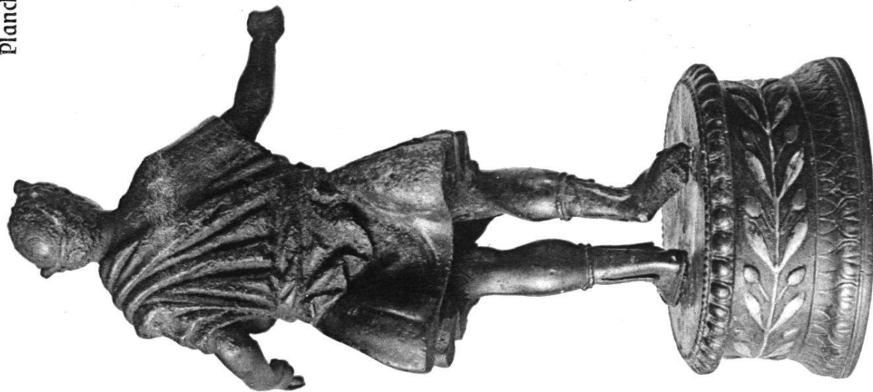
3. Dieu Lare (Avenches)