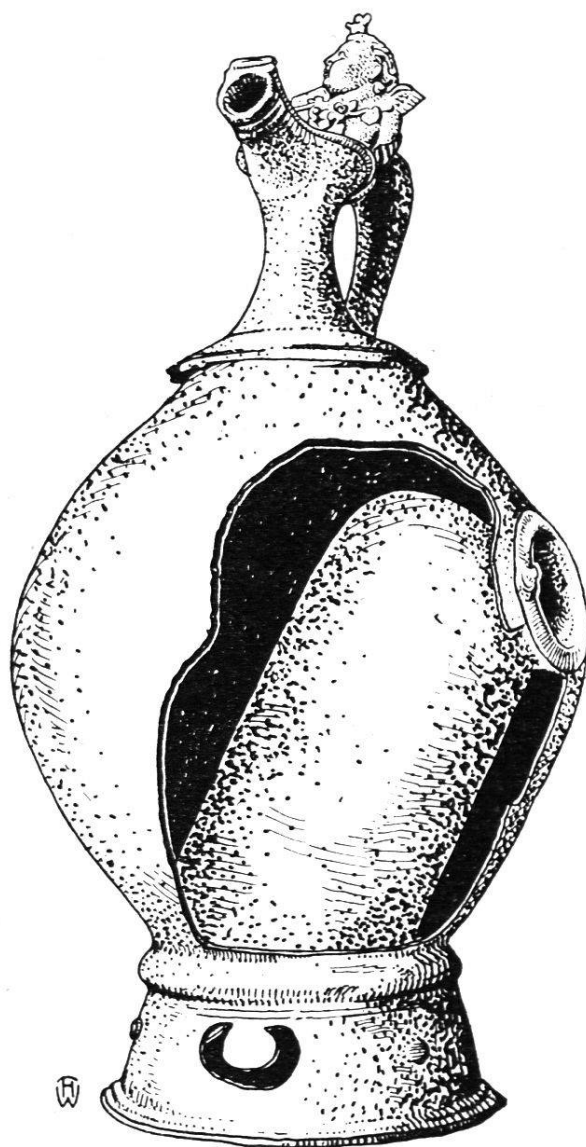
Conpe de l'intérieur.

calement, comme c'est le cas dans la plupart des appareils de ce genre; il est incliné, de manière à éviter tout conflit avec le goulot du vase lui-même et à présenter une plus grande surface de chauffe. On y introduisait les charbons ardents par