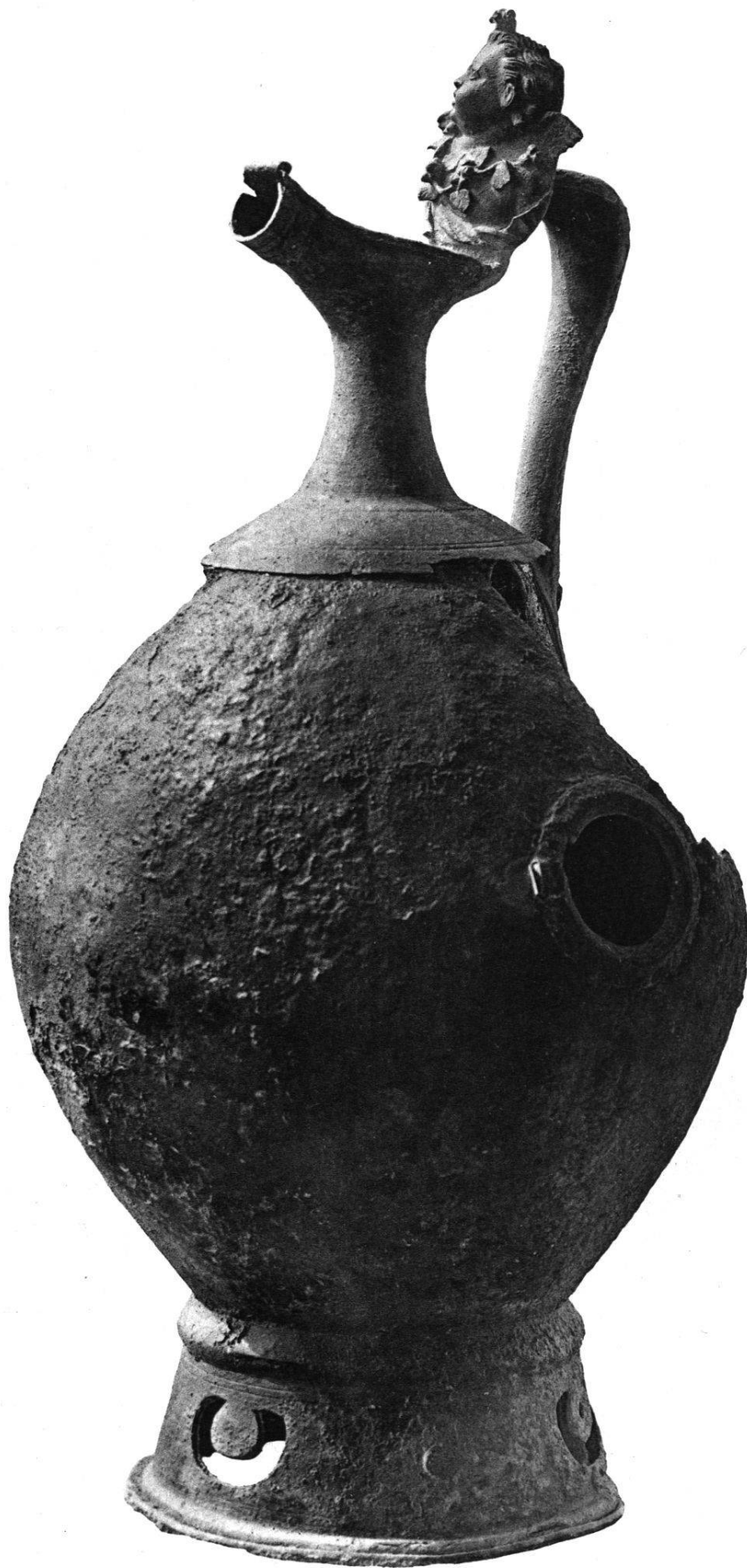
Samovar trouvé aux Champs-Baccon le 23 Mars 1910 Echelle 1/3.

Bulletin de l'Association PRO AVENTICO N° XI, 1912. Pl. I.