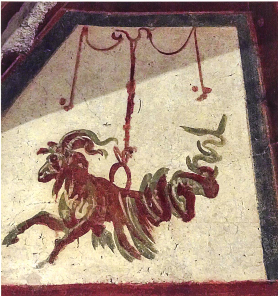
Steinbock als Dekorationselement in der «stanzza dell'Orante» der Case Romane in Rom, 4. Jahrhundert n. Chr.

Mit der Übernahme des ursprünglich zum Tierkreiszeichen gehörigen Motivs von der besonderen Affinität des Steinbocks zur Kälte in die Beschreibung des real existierenden Tieres korrespondiert die sowohl von Conrad Gessner als auch Durich Chiampell bezeugte Bedeutungsverschiebung des Terminus capricor-