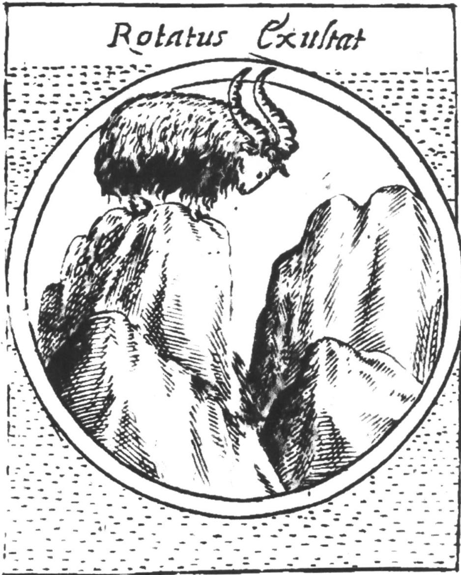
Steinbockemblem von 1623.

ihrem Kopf die Last der gewaltigen, mit Schwertscheiden vergleichbaren Hörner tragen. In diese Masse verlegt der Steinbock – hauptsächlich wenn er von einem Felsspitz zum andern hinüberspringen will – seinen Schwung und schießt wie von einem Katapult weggeschleudert aufwärts in die Felsen, wohin es ihm gerade beliebt; durch das Zurückprallen vom Fels wird er dabei nur noch flinker.» 13 Noch das 17. Jahrhundert sah darin die hervorstechendste Eigenschaft des Steinbocks, wenn ein Emblem den zu einem Sprung über einen klaffenden Abgrund ansetzenden Steinbock zeigt mit dem an Plinius' Wortlaut angelehnten Motto «Rotatus Exultat» – Wie von einem Katapult weggeschleudert, springt er in die Höhe. 14