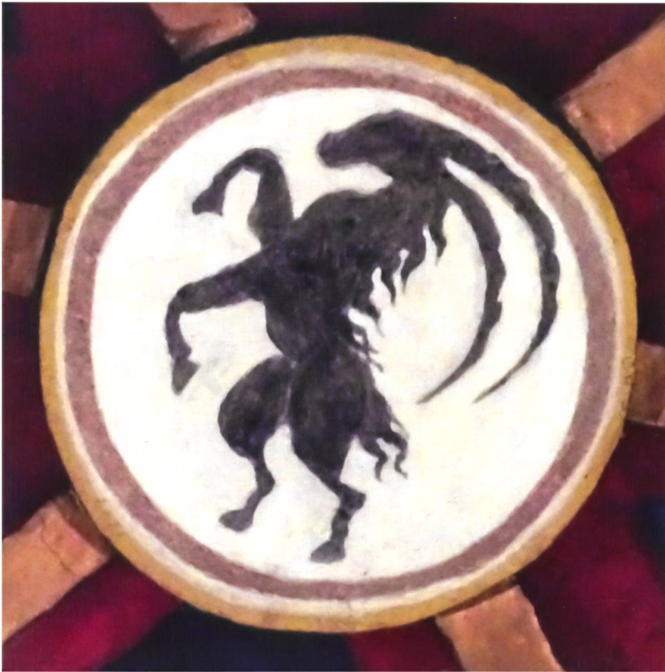
S. Vittore, Poschiavo: Schlussstein, um 1500.

Von der Omnipräsens der mittelalterlichen Bestiarien zeugt z. B. das Gewölbe von Poschiavos Stiftskirche S. Vittore, das zwei um 1500 angefertigte Schlusssteine mit Darstellungen von Pfau und Steinbock schmücken. 43 Auch wenn im Pfau ein Schwan zu sehen wäre, so sind diese – wie viele andere Tierdarstellungen im kirchlichen Kontext – natürlich allegorisch zu lesen. Würde man im Schwan zudem einen Pelikan sehen, hätte man es mit einer Darstellung zu tun, deren allegorische Bedeutung ebenfalls im «Physiologus» abgehandelt wird, jener vorhin genannten, auf die Spätantike zurückgehenden und in der Folge breit rezipierten Sammlung von Tierporträts, die einer symbolischen Naturauslegung verpflichtet sind. 44 Wie sehr diese Art der Naturbetrachtung auch im Rätien des 16. Jahrhunderts bekannt war, bezeugt Fabricius Montanus' eben erwähntes, 1563 erschienenes Büchlein über die göttliche Vorsehung mit der durch das Verhalten des Storches gestützten These, dass der Mensch sich für sein sittliches Verhalten auch Tiere zum Vorbild nehmen könne. 45 Seinen Einzug ins kirchliche Umfeld verdankt der Steinbock der in unseren heutigen Ausgaben des «Physiologus» unter der