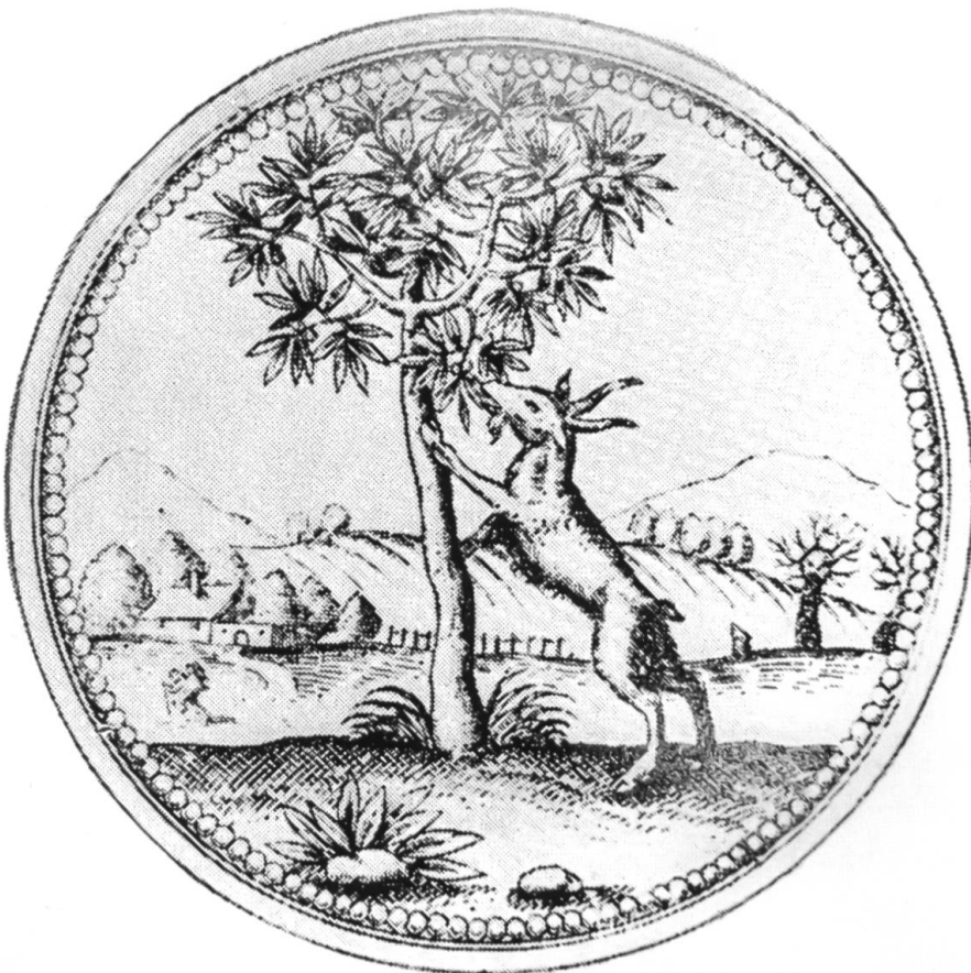
Barockes Sinnbild für den Ehrgeiz.

Wenn der Bock in der Folge immer enger der Gestalt des Steinbocks angeglichen wurde, könnte darin mit guten Gründen ein Reflex lokaler Gegebenheiten gesehen werden. Bei gleicher theologischer Konnotation zieht ja wohl auch ein Bischof das stattlichere Tier vor, zumal es in Rätien heimisch war. Und wenn man sich über das Abbild der Weisheit Gottes zusätzlich noch mit Kaiser Augustus in eine Linie stellen konnte, der das Sternzeichen des Steinbocks als Herrschaftszeichen verwendete, dann umso besser; das Wissen darum konnte aus so populären Schriften wie Suetons Kaiserbiografien bezogen werden. 62 Für alle, die Allegorien zu