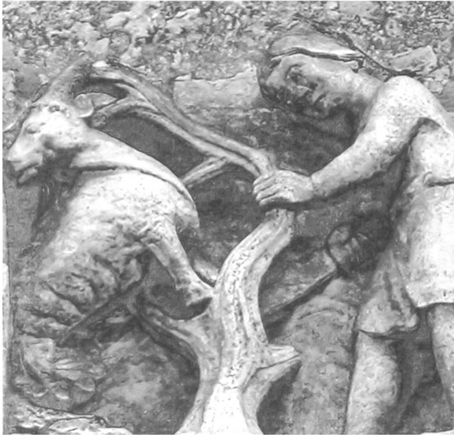
Monatsbild für den Dezember am Dom von Cremona, 12. Jahrhundert ( https://commons.wikimedia.org/w/index.php?curid=54592802 ).

überaus steil abfallenden Felsen der beinahe unzugänglichen höchsten Lagen der Alpen auf, die in der Nähe jener oben beschriebenen im Lauf der Zeit vergletscherten Schneemassen liegen. Dieses Tier sucht nämlich notgedrungen die Kälte auf – andernfalls würde es binnen Kurzem erblinden», berichtet Chiampell nach Stumpf vom Steinbock; nach Chiampells Auftraggeber Josias Simler liegt das Habitat des Steinbocks seiner Augen wegen sogar ausschliesslich im ewigen Eis, so dass sich eigentlich die Frage aufdrängt, ob denn ein Simler im Gletschereis eine hinreichende Ernährungsgrundlage für den Steinbock sah. 25 Dass der Steinbock in milderer Lagen sein Augenlicht verlieren sollte, widerspricht im Übrigen der Behauptung, dass sich der Steinbock zähmen und zusammen mit den Hausziegen halten lasse. 26