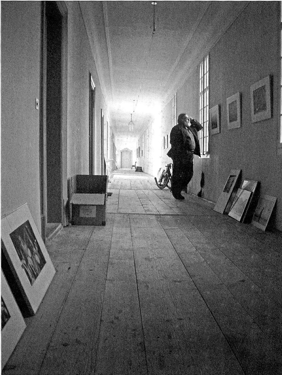
Die lange Galerie des Seitenflügels, das Spielparadies der Kinder im 19. Jahrhundert.

Vorhangsstangen, an Gurten von der Decke herabhängenden Matratzen und Nachttischchen auch zwei schöne Empiremöbel aus Mahagoni und Bronze, die später wieder zu Ehren gezogen wurden.