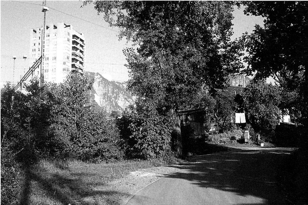
Abb. 4 Amerika in Igis! Amerika, ein Auenwäldchen westl. des Bahnhofs Landquart. Wahrscheinlich ein Juxname für neuerschlossenes Land wie Kaliforniahof und Ägypten in Malans. Auch Trun im rom. Sprachgebiet kennt ein «Amerika» (RN 16).

vergleicht die Karte mit dem Gelände, hält fotografisch die Örtlichkeit fest und macht Notizen. Der Laptop kann nützlich sein, verdrängt aber den guten alten Zettel im Postkartenformat keinesfalls. Auch im unwegsamsten Tobel sind die Namenskärtchen in der Brusttasche vor Schaden bewahrt! Auf den Zettel schreibt man alles, was man an Ort und Stelle beobachtet und von einem begleitenden Gewährsmann erfährt. Als Gewährsleute drängen sich alte Landwirte, Förster, Hirten und Jäger auf. Sie kennen noch die Natur, ihre Gesetze, Tücken und Launen und besonders aber die Namen der Örtlichkeiten, von denen keine Karte, kein Plan etwas weiss.