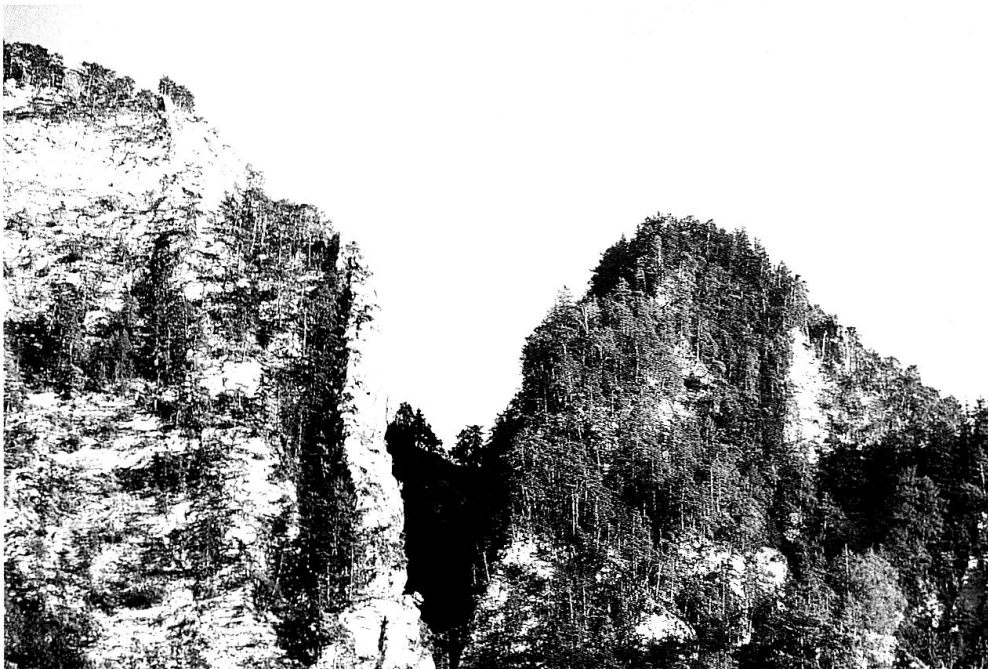
Abb. 1 Das Bild vom Einschnitt ins Valcoppa zeigt deutlich die «Cup (Schüssel)-form».

Viele Wege führen zum Ziel jeder Flur- und Ortsnamensammlung: zur Sicherstellung eines alten Kulturgutes und zu dessen Zugang nicht nur für wenige interessierte Toponomastiker 2 , sondern für ein breites Publikum. Dieses gilt es anzusprechen und für die Sache zu gewinnen. Der Umgang mit einem Kulturgut muss vor allem dann zur allgemeinen Pflicht werden, wenn es bedroht ist. Der Wandel der Kulturlandschaft hat im 20. Jahrhundert unter anderem auch zum Verlust eines vielfältigen Namengutes geführt 3 . In der Bewahrung der Relikte und im Zusammentragen des Flur- und Ortsnamenschatzes liegt