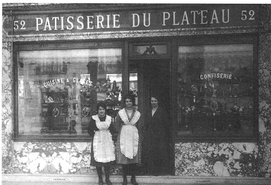
Vom Land der 150 Täler nach Paris, Székesfehérvár, Ybicaba...

Zeitschrift für bündnerische Geschichte und Landeskunde