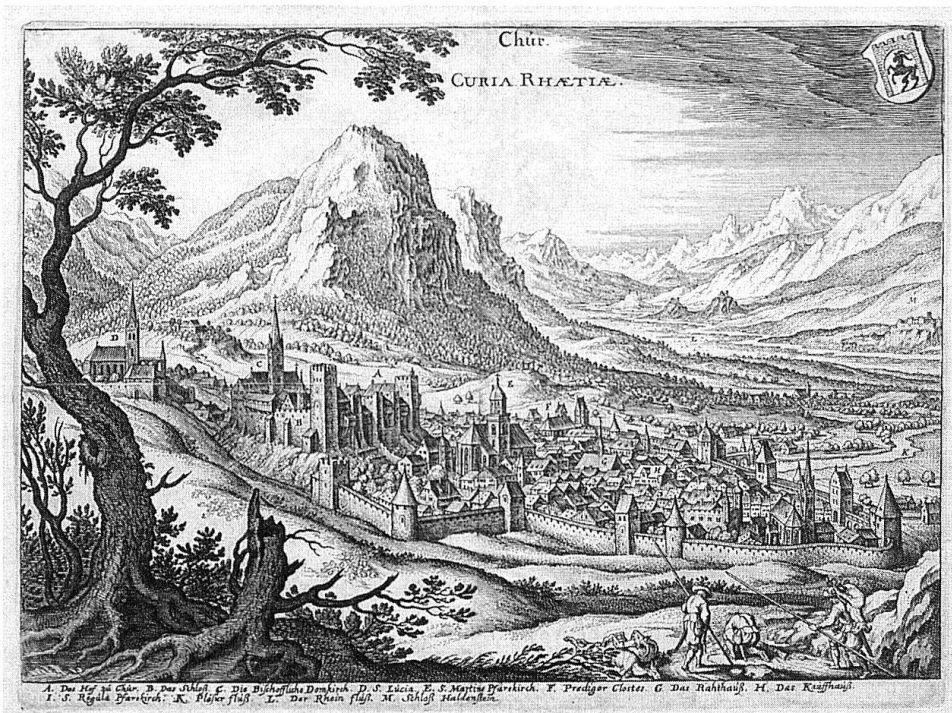
Stadtbefestigung mit Ringmauer und Türmen, um 1615 (Matthäus Merian).

vor der Stadt verwüstet wurde. Mit der Zeit verloren die Stadtmauern aber an Bedeutung, so dass 1797 der Deutsche Heinrich Ludwig Lehmann spöttisch vermerken konnte: «Und doch rühmen die Bündner von ihrer Hauptstadt: Sie sey unüberwindlich durch ihre auffälligen Stadtmauern, durch die Bauhaufen (Misthaufen) in den Strassen und durch die Mässigkeit ihrer Bewohner. Die Sturmleitern würden nicht befestigt werden können und die herunterfallenden Steine erschlugen die Grenadiere...» 2 Vor ihrem Abbruch, in der ersten Hälfte des 19. Jahrhunderts, war dann die Anlage in einem so bedenklichen Zustand, dass schliesslich ganze Mauerteile einstürzten.