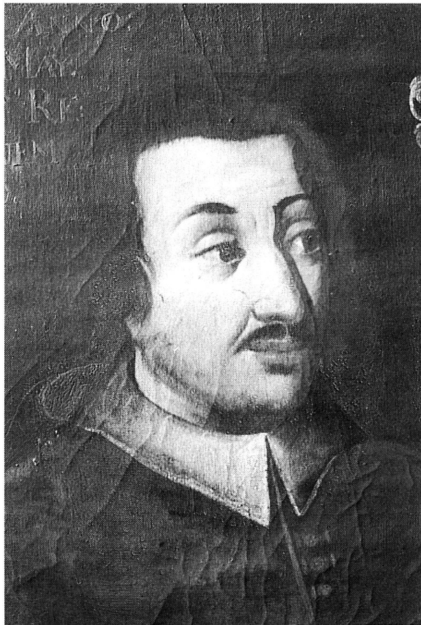
Fürstbischof Beat à Porta (1565–1581) (Bischöfliches Schloss Chur)

Der nach dem Tod Bischofs Thomas Planta am 23. Mai 1565 neu gewählte Churer Oberhirte, Beat à Porta (1565–1581) 83 stammte nicht aus dem Gotteshausbund, sondern seine Familie kam aus Davos, dem Zehngerichtebund. Nach der Wahl à Portas erhob sich unter Einfluss des Gotteshausbundes eine kleine Minderheit und stellte Bartholomäus von Salis zum Gegenbischof auf, der sich mit seinem Anhang des bischöflichen Schlosses in Chur bemächtigte. Natürlich wandten sich beide Parteien um Unterstützung ihrer Kandidaten an Kaiser und Papst. Pius IV. bestätigte am 24. August 1565 Beat à Porta als rechtmässig gewählten Nachfolger Plantas, und im November 1565 empfing dieser in Rom die Bischofsweihe. Doch erst am 2. Januar 1567 konnte Beat à Porta nach erfolgreichen Vermittlungen der Eidgenossenschaft beim Gotteshausbund in der bischöflichen Residenz Wohnsitz nehmen.