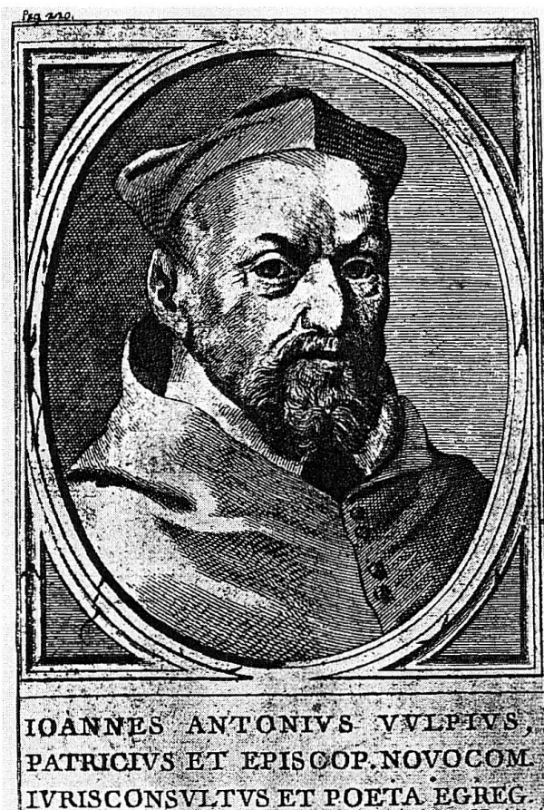
Nuntius Giovanni Antonio Volpe Bildnis abgedruckt in: Karl Fry (Hrsg.), Giovanni Antonio Volpe Nuntius in der Schweiz. Dokumente Band II (1565–1588), Stans 1946

Plan darlegte. Der Nuntius versprach sich wenig vom Unternehmen Ruginellis, obwohl sich eigentlich der Graue Bund auf dem Januarbeirat zu Chur 1562 für eine Beschickung des Konzils ausgesprochen hatte. 64 Der Graue Bund – so befürchtete Volpe nicht zu Unrecht – würde sich gegen den Gotteshaus- und Zehngerichtebund nicht durchsetzen können. Ebenso befürchtet Volpe, die bereits angeschlagene Autorität des Papstes könnte dadurch noch grösseren Schaden verursachen, da bei dieser Aktion alle ihn im Verdacht hätten, Urheber dieses Planes zu sein. Aus einem Schreiben vom 18. Mai 1562 an Carlo Borromeo betrachtete Volpe Ruginellis Vorgehen deshalb als eine cosa difficilissima et fuori di speranza . 65 Der Nuntius sollte Recht behalten: Mitte August 1562 war auch die Mission Ruginellis gescheitert, wenigstens den Grauen Bund für die dritte und letzte Phase des Trienter Konzils, die entscheidende «Reformphase», zu gewinnen.