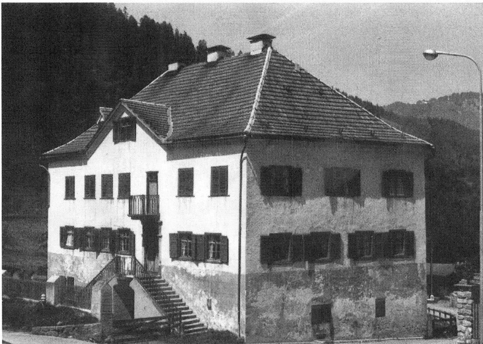
Das Planta-Haus (Badwirtschaft) mit der Doppel- treppe des 19. Jahrhunderts, vor dem Umbau von 1982 (Foto Denkmalpflege Graubünden).

Irgendwann im 19. Jahrhundert war der Hauseingang in den ersten Stock verlegt worden, und das ursprüngliche Portal darunter diente mithin als Kellertüre. Das Gewölbe der damals erstellten Doppel- treppe zum neuen Eingang verdeckte in der Folge die Bauinschrift oben auf dem Torbogen. Sichtbar blieb aber wenigstens der Name des Bauherrn und das Baujahr. Im Zuge der Erneuerung wollte man den