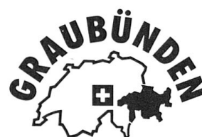
Die Ferienecke der Schweiz.