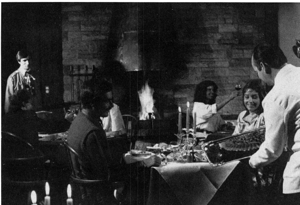
Abb. 3: Der Einsatz von Saisonarbeits- kräften ist eine Voraussetzung für die Funktionsfä- higkeit der Bünd- ner Wirtschaft.

Teilweise können die Saisonschwankungen mit Erwerbskombinationen oder Teilzeitbeschäftigungen aufgefangen werden. Daneben ist aber der Einsatz zahlreicher, vor allem ausländischer, Saisonarbeitskräfte eine unabdingbare Voraussetzung für die Funktionsfähigkeit der Bündner Wirtschaft und damit auch für die Sicherung der Erwerbsmöglichkeiten für die einheimischen Arbeitskräfte.