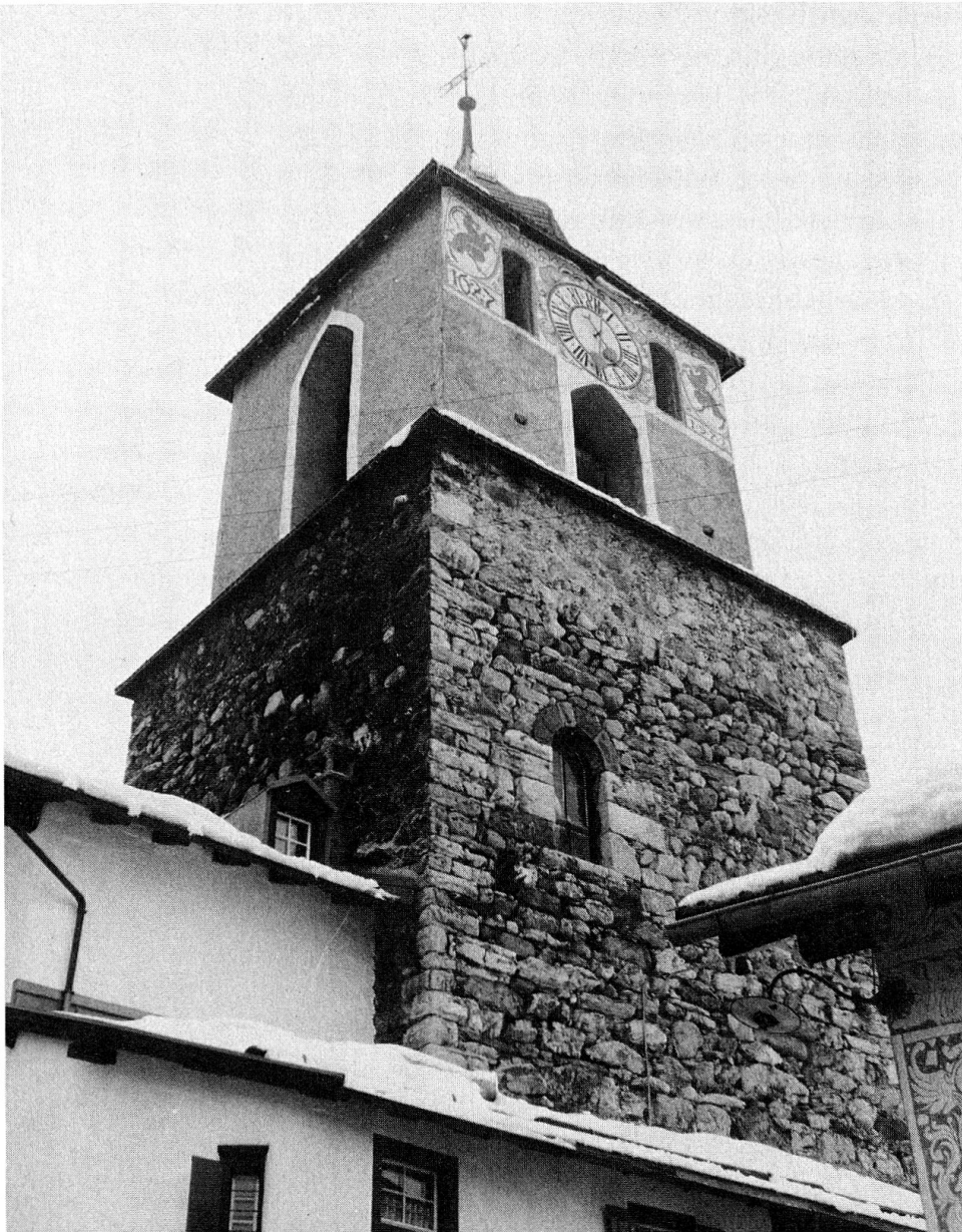
Bergün als Hauptort der gleichnamigen Gerichtsgemeinde mit dem vor 1200 erbauten Gerichtsturm.