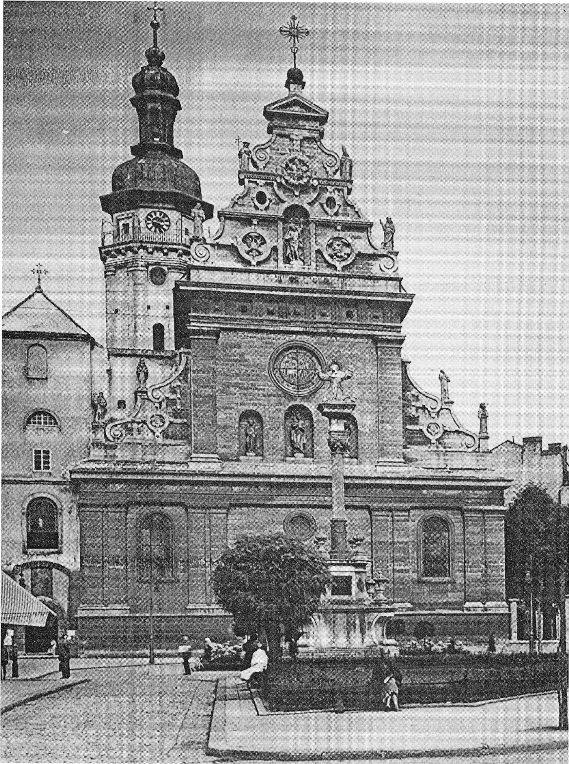
Die Bernhardiner-Kirche in Lemberg (heute russisch: Lwów) mit ihrer eigenartigen Fassade, ein Gemeinschaftswerk von P. Dominici und A. Nutclaus/Vaberene.