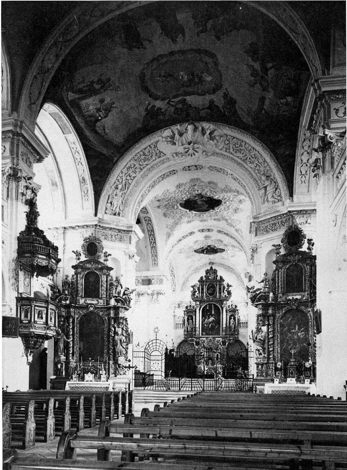
Barocke Klosterkirche im Jahre 1914 – Restaurierter Chor mit Fresken von Fritz Kunz.