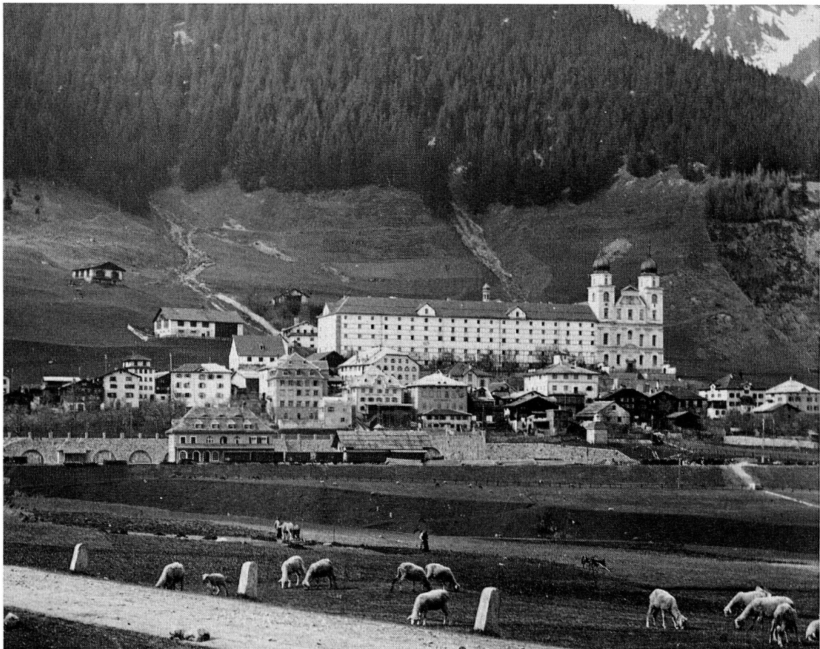
Kloster und Dorf Disentis im Jubiläumsjahr 1914.

und Öde and Öde, so haben die schwarzen Kuttenträger das Land vorgefunden. Sie haben den Kampf mit dem Urwald mit starker Hand aufgenommen; sie haben weite Strecken Landes selbst gereutet und urbar gemacht und auch die armen, halbwilden Menschen unterrichtet, dass sie den Boden zu bebauen und richtig zu befruchten lernten. Die finsternen Mönche waren die ersten Kulturingenieure, die ersten praktischen Agrarpolitiker unseres Landes. Und dann galt es, den ungefügten harten Köpfen etwas Gesittung beizubringen, sie in die Wahrheiten des Christentums einzuführen, ja, nach und nach die ungelehrigen, ungelenkten Hände Stift und Federkiel führen zu lehren. Die Mönche im schlichten Benediktinerhabit haben die ersten Schulen des Landes gegründet, haben die ersten Pflegestätten für Kunst und Wissenschaft angelegt. Noch kein einziger ernster Historiker hat es gewagt, den wackeren Männern im rauhen Mönchsgewande dieses Verdienst abzuspochen, und die wahrhaft riesige Kulturarbeit der Mönchsorden muss jedem objektiv Denkenden aufrichtige Ehrfurcht abringen.