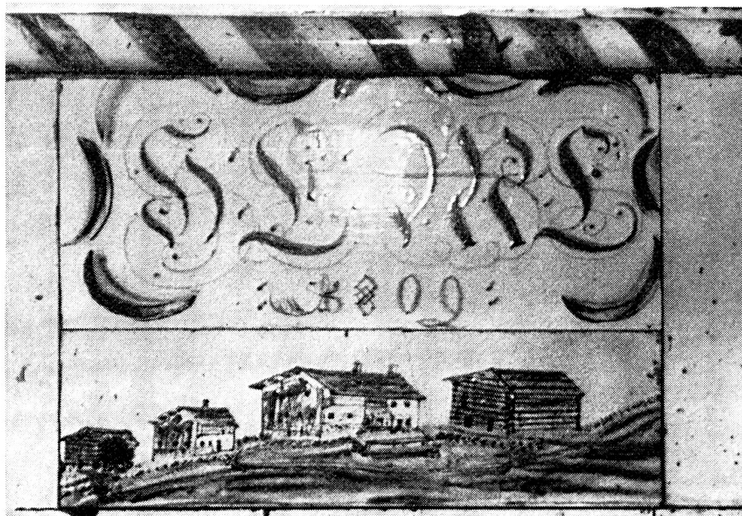
Abb. 1. St. Antönien. Ansicht der Ronegg, 1809. Ofenkachel von Andreas Lötcher.