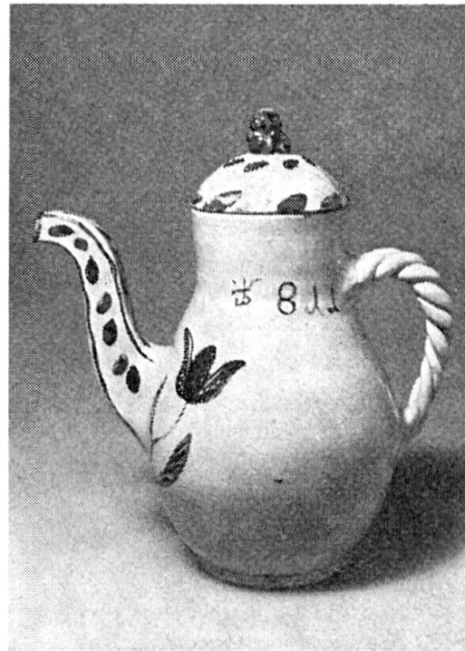
Abb. 5. P. Lötcher. Kaffeekrug. 1811