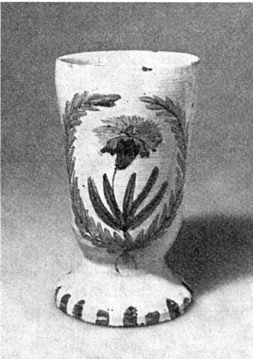
Abb. 4. P. Lötcher. Grosser Kelch. Um 1810