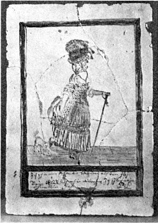
Abb. 2. P. Lötcher. Ofenkachel. Ende 18. Jh.