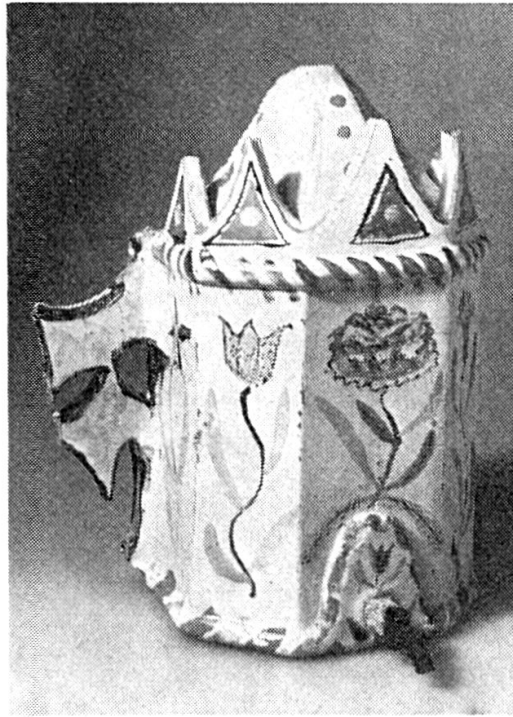
Abb. 3. P. Lötcher. Giessfass. Ende 18. Jh.