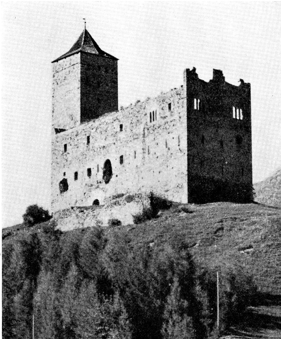
Burg Reams im Oberhalbstein. Imposantes Sinnbild einstiger bischöflicher Machtstellung! Im 12. Jahrhundert durch die Herren von Wangen im Tirol erbaut, ging sie schon 1258 an das Bistum über. In der Zeit der Vazer Fehden stellte die Burg Reams für den Bischof von Chur einen bedeutenden Stützpunkt dar. Hier amtierten mehrere Oberhalbsteiner als Ministerialen des Bischofs, der berühmteste unter ihnen, Benedikt Fontana, in den letzten Jahren des 15. Jahrhunderts.