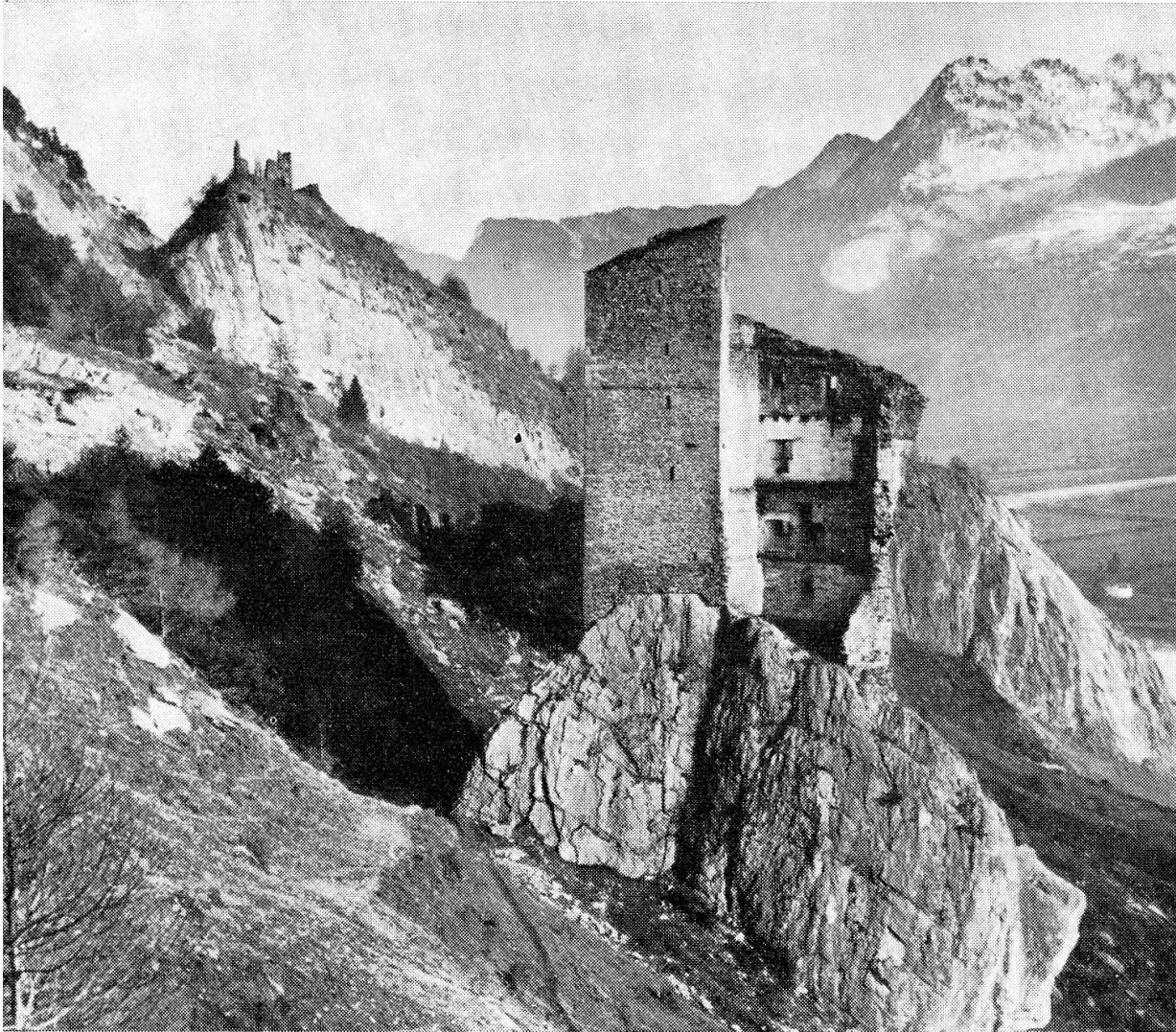
Burg Haldenstein. Noch heute erweckt die auf einem im steilen Gelände aufsteigenden Felsen errichtete Buranlage großen Eindruck. Die oberen Teile wurden vor 1299 von Johann von Vaz aus- und umgebaut. Links Burgruine Lichtenstein.

um 1295, kaum 20jährig, zu jung noch, um sich für angetanes Unrecht wehren zu können, nicht aber, um es nicht zu vergessen. Achtundzwanzig Jahre später entlud sich der angestaute Haß in einer größeren Fehde.