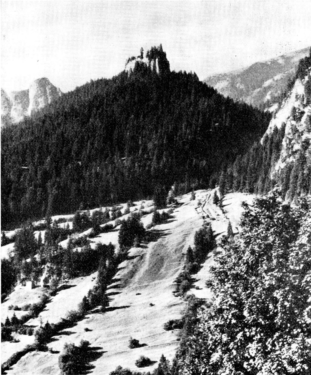
Burg Belmont bei Flims. Sitz der Herren von Belmont, die erstmals 1139 erscheinen; im 13. und 14. Jahrhundert gelang es diesem Geschlecht, das Gebiet von Flims sowie Güter und Leute in der Gruob, im Lugnez und Vals zu einer ansehnlichen Herrschaft zusammenzufassen. Mit dem Tode Ulrichs von Belmont 1371 starb das Haus aus; die Herrschaft ging an die Herren von Sax und 1483 an den Bischof von Chur über. Die Burg war bereits 1380 zerfallen.