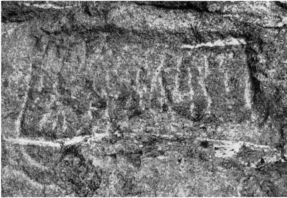
Abb. 2 a und b. Die Inschrift von Raschlinas, mit Andeutung einer kauernenden, 38 cm langen menschlichen Figur.