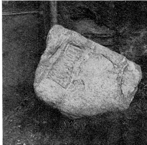
Abb. 1. Die Grabstele von Raschlinas als Prellstein.

stand und daß seine ungefähr rechteckige Form eine zufällige, natürliche sein mußte. Umsomehr überraschte mich dann plötzlich die Entdeckung von Schriftzeichen, die in einem rechteckigen Rahmen lagen; ein etruskisches Lambda erkannte ich auf den ersten Blick! Ein eingehenderes Studium des Objektes erlaubte der sinkende Tag jedoch nicht.