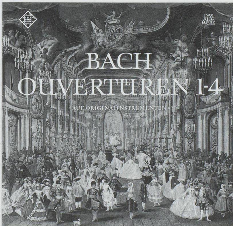
Abb. 4: Kassettentitel Telefunken SAWT 4509/10-A, veröffentlicht 1967/68.