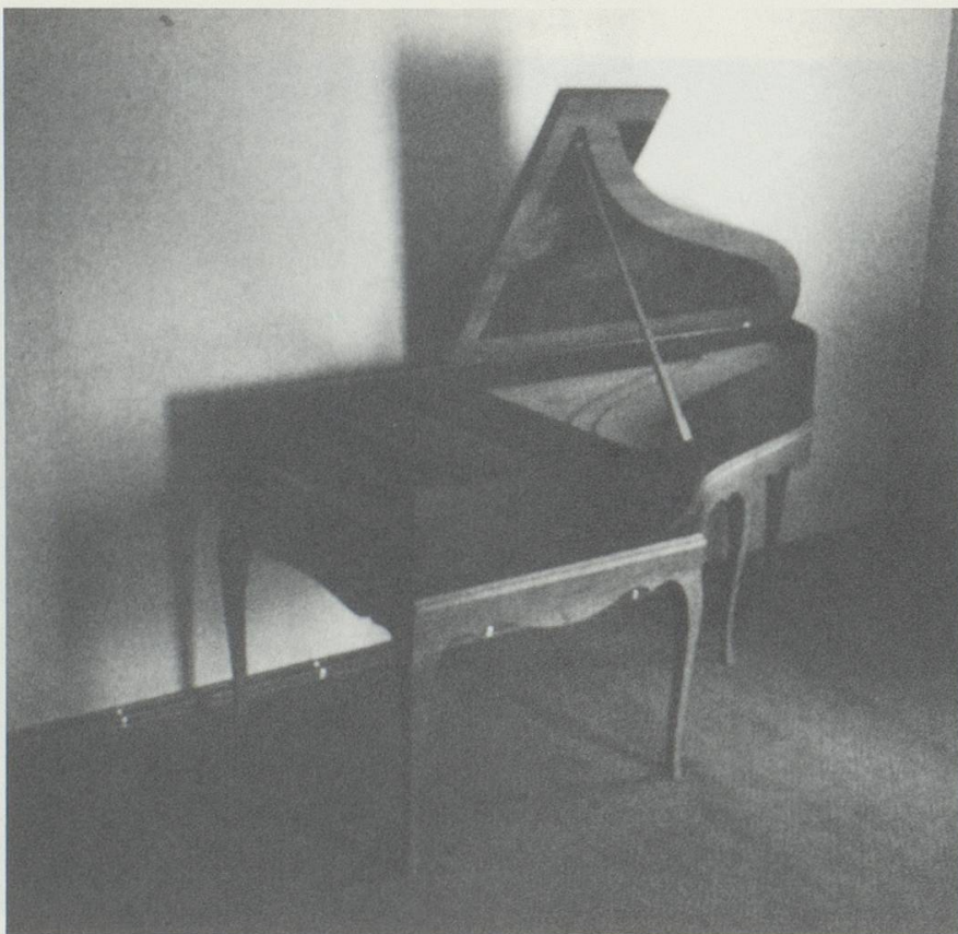
Abb. 6: Gesamtansicht des rekonstruierten Theorbenflügels.