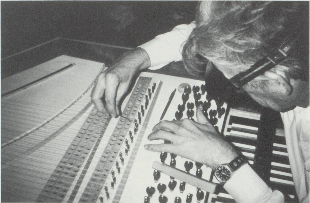
Abb. 5: Einfeilen „subtiler Kerben“ zum Einlegen der Saiten. Rechts der kombinierte Stimmstock mit Lautenwirbeln.