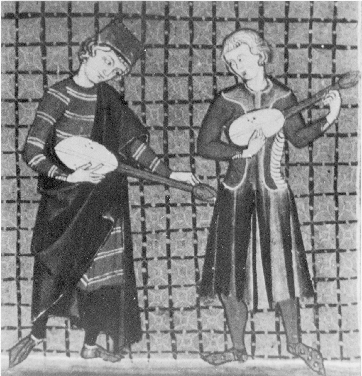
Abb. 6: Cantigas de Santa Maria , f. 133.

1. Ein ovaler Typ mit geraden Seiten, kurzem Hals, Wirbelblatt und hinterständigen Wirbeln, drei Saiten, Sattelknopf, verziertem Saitenhalter (Schalloch nicht genau erkennbar), mit den Fingern gespielt in der Art, wie heute noch die Gitarre gespielt wird (Abb. 1, 2). Dieser Typ wird auch mehrfach beim Stimmen gezeigt, hier sind dann C- oder ovale Schalllöcher und Steg zu erkennen (Abb. 4). Das Wirbelblatt ist hier anders ausgeführt (Abb. 4.): spitz-oval, als Kasten, hinten offen, vorderständige Wirbel, die Saiten werden durch eine Öffnung direkt hinter dem Sattel durchgeführt und in dem hinten offenen Kasten mit den Wirbeln verbunden. Die gleiche Konstruktion findet sich bei Instrumenten der Cantigas (Abb. 8–10) und noch bei der Lira da braccio des 16. Jahrhunderts.