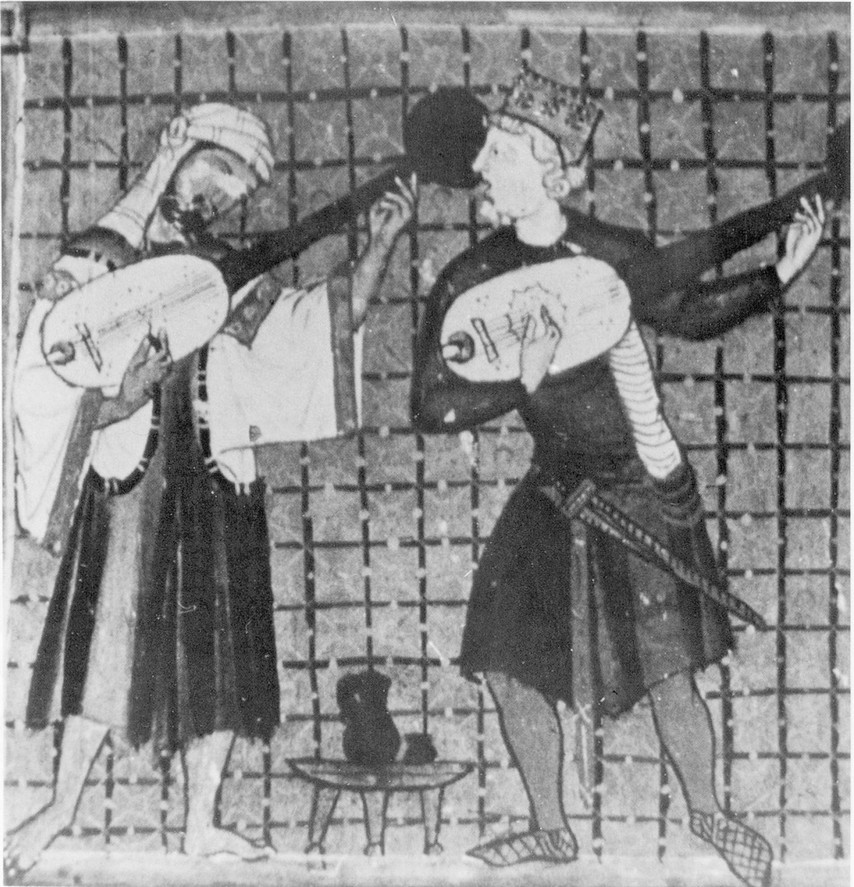
Abb. 5: Cantigas de Santa Maria ; El Escorial, Códice j. b. 2, f. 125 (um 1280).

Die herausragendsten Darstellungen bis zum Ende des 12. Jahrhunderts sind ohne Zweifel die Skulpturen an der Kathedrale von Santiago de Compostela (Abb. 1–4). Dank einer später davor gesetzten Barockfassade sind sie optimal erhalten. Ihre Detailfreudigkeit und realistische Genauigkeit läßt weder in der Darstellung der Figuren, der Gewänder, der Instrumente noch in den Spiel- und Stimmszenen zu wünschen übrig. Sie verdienen eine intensivere Untersuchung, die weit über die Betrachtung von Fotos hinauszugehen hätte. Neben Psalter, Harfen und Organistrum sind zwei Typen von Griffbrettinstrumenten dargestellt: