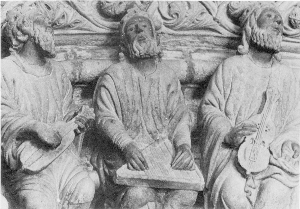
Abb. 2: Santiago de Compostela, Kathedrale, Portico de la Gloria . (nach 1168).

Die Frage nach dem Realitätsgehalt, der Aussagekraft mittelalterlicher Instrumentendarstellungen kann in diesem knappen Rahmen nicht aufgeworfen werden. Sie ist immer noch die Kernfrage der Ikonographie, obwohl sie in den letzten Jahrzehnten häufig diskutiert wurde. 11 Es scheint, daß der Symbolgehalt vieler Darstellungen zu sehr in den Vordergrund gerückt wurde, darüber aber realistische Darstellungen nicht erkannt wurden. Die Beurteilung einer mittelalterlichen Instrumentendarstellung wird für jeden Fall neu und für sich anzugehen sein, sie darf sich nicht allein auf das Instrument beziehen, sondern muß den ganzen Kontext so sorgfältig wie möglich mit einbeziehen. 12