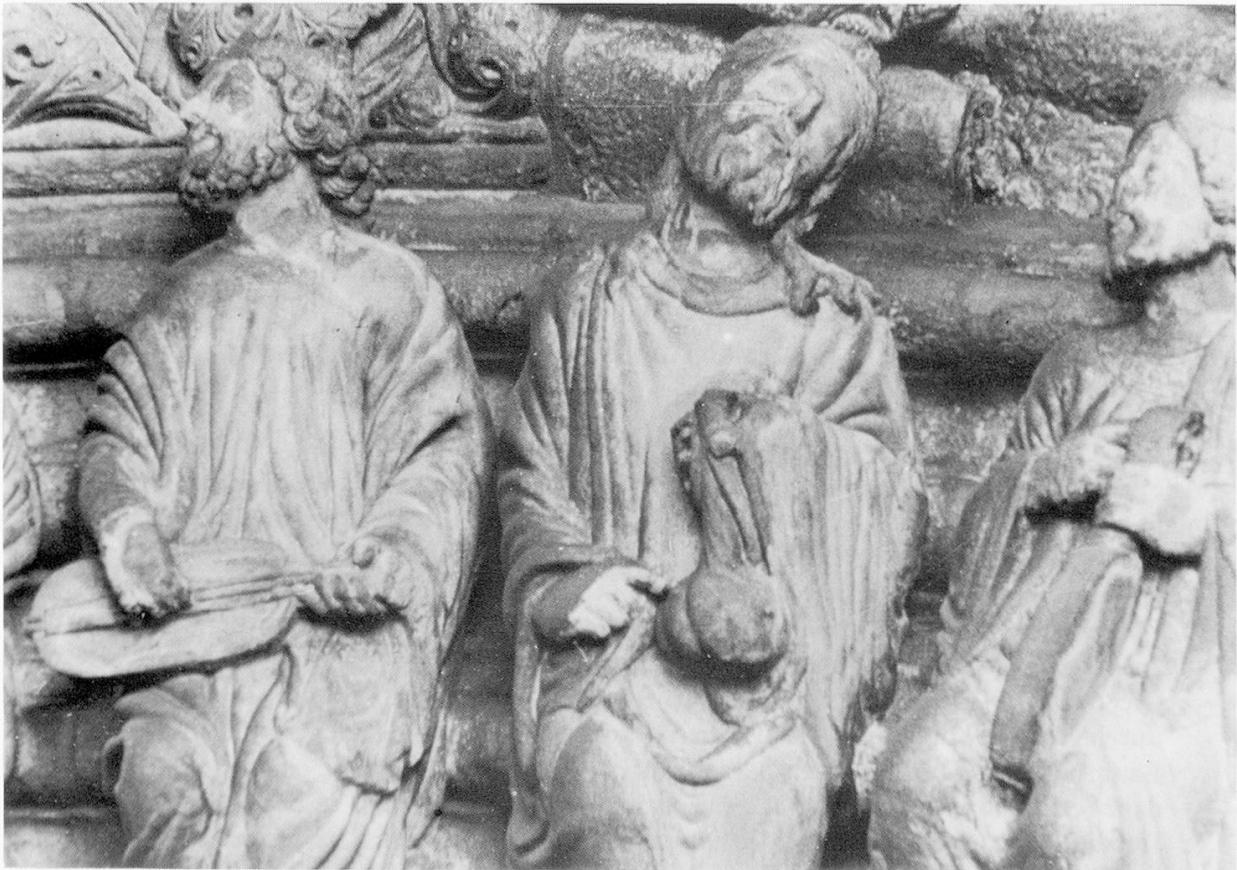
Abb. 1: Santiago de Compostela, Kathedrale, Portico de la Gloria (nach 1168).