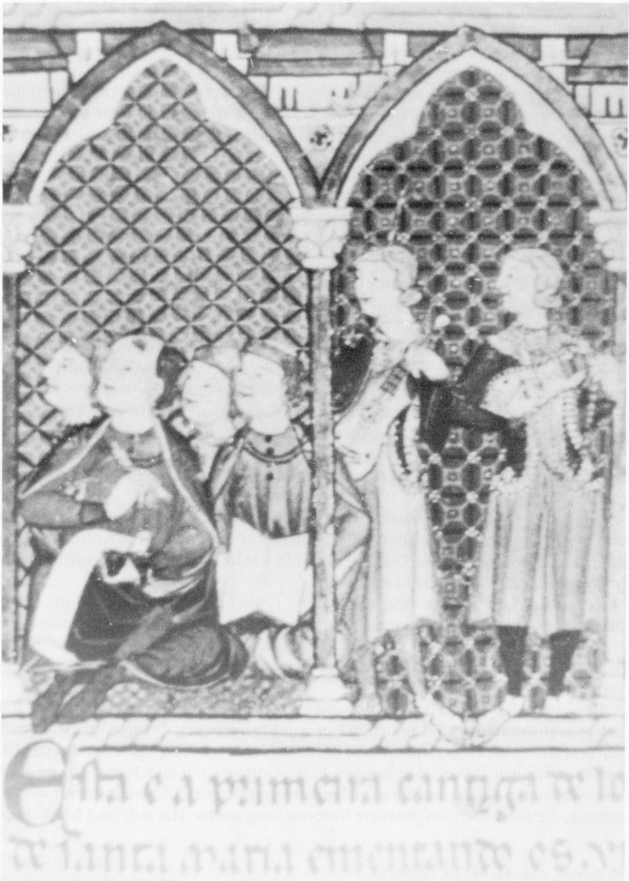
Abb. 10: Cantigas de Santa Maria , f. 29.