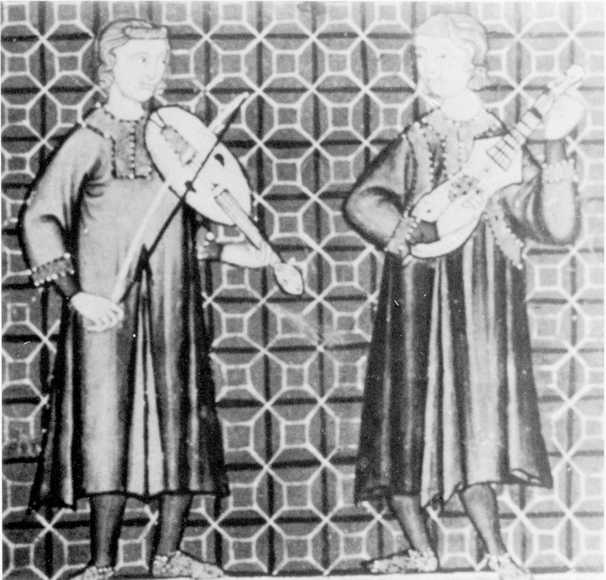
Abb. 9: Cantigas de Santa Maria , f. 39'.

in die Fläche hineingeklappt. 23 Die Ausführung dieser Details in bisherigen Rekonstruktionen ist m. E. übertrieben. Das daneben abgebildete Instrument zeigt sehr deutlich solch einen sichelförmig gebogenen Wirbelkasten mit Tierkopf (Abb. 8), nicht aber das linke Instrument. Darüber hinaus haben die drei übrigen Instrumente gleichen Types lediglich an dieser Stelle des Wirbelkastens eine Verdickung, die einen geschnitzten Kopf andeuten könnte. Alle Instrumente zeigen Bünde, dargestellt durch Linien dicht nebeneinander, was den Schluß zuläßt, daß für einen Bund zwei Saiten um das Griffbrett herumgebunden sind, oder daß es sich um einen festen, aufgeleimten oder in das Holz eingelassenen Bund aus Holz, Knochen, Elfenbein oder Metall handeln könnte. Alle Instrumente haben Sattelknopf, untergeklemmten, geraden Steg, Zentralrosette, weitere Verzierungspunkte, sowie eine