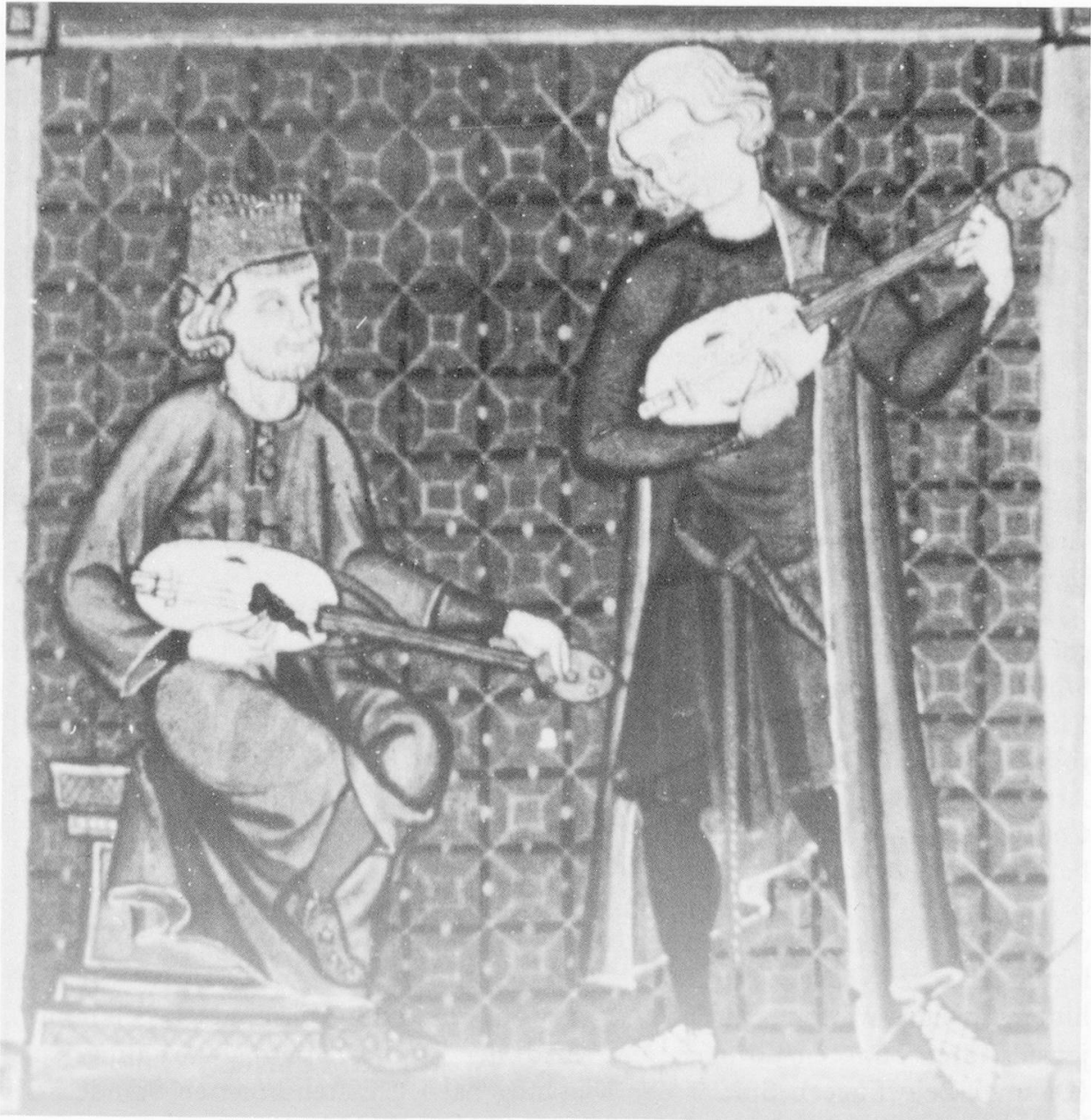
Abb. 7: Cantigas de Santa Maria , f. 140'.

Eine Vielfalt verschiedener Formen 18 – Toro, Estella, Sasamon, Orense, Santiago (Palacio), Burgo de Osma, Léon, Burgos, Anger, Straßburg, Bayonne, Vienne, Reims, Rouen, Exeter, Beverly, um nur einige Orte zu nennen –, dokumentieren diese Experimentierfreudigkeit, das Spiel mit neuen technischen Möglichkeiten, das Suchen nach neuen Formen, provoziert durch neue Spieltechniken (Bogen), gefordert sicher auch durch neue musikalische Vorstellungen ( ars nova ) und Anregungen (arabische und europäische Spielleute). 19