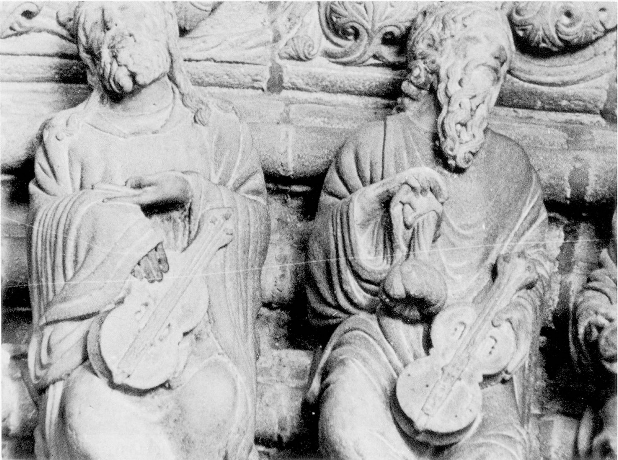
Abb. 3: Santiago de Compostela, Kathedrale, Portico de la Gloria (nach 1168).