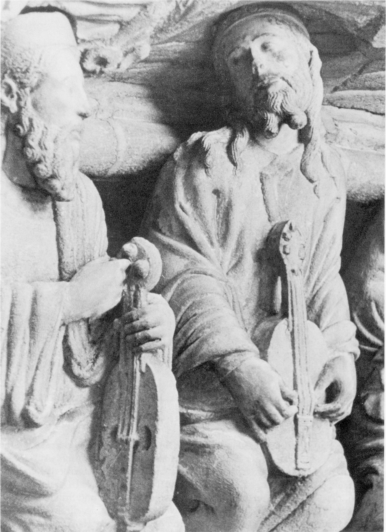
Abbildung 4: Santiago de Compostela, Kathedrale, Portico de la Gloria . 11. Jahrhundert.