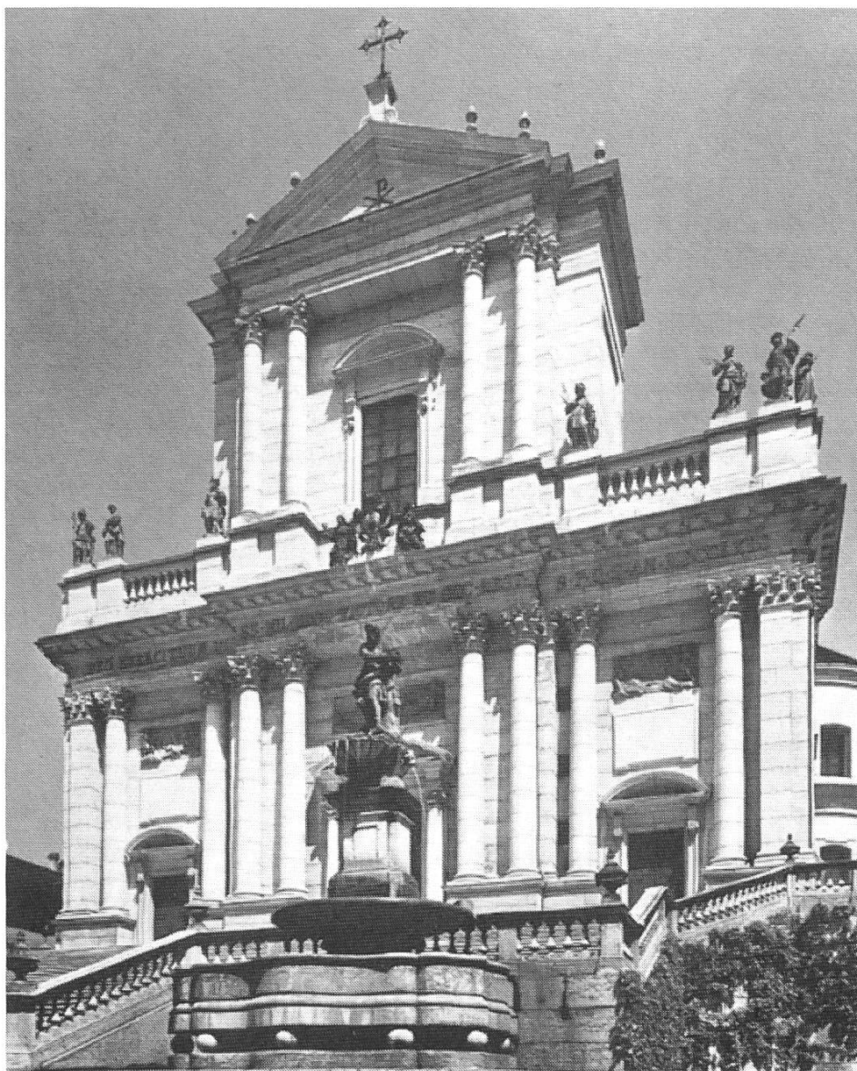
St. Ursen-Kathedrale. Hauptfassade.

den im Verlauf der Kirchengeschichte vornehmlich den Frauen über- und aufgetragen. Vor dem Hintergrund ihrer Vita lässt sich freimütig sagen: Verena war eine «evangelische» Apostelin und eine sympathische dazu. Anders als beispielsweise der iroschottische Missionarsmönch Kolumban der Jüngere (gest. 615), der durchaus mal einen heidnischen Priester erschlagen konnte, um die Macht seines Gottes zu demonstrieren, 235