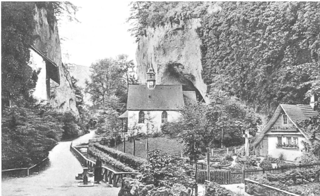
Einsiedelei St. Verena, Solothurn. Postkarte, ungebraucht. Ca. 1920 (Slg. Museum der Kulturen Basel).

Oberägypten. Beachtenswert ist, dass sich zu dieser Zeit in Ägypten das Mönchtum auszubreiten begann. Junge koptische Christen und Christinnen zogen sich in die Wüste 34 zurück, um ein radikal auf die Christusbachfolge ausgerichtetes Leben zu führen. Es war eine Art Gegenbewegung zu der sich herausbildenden Volkskirche, die sich mit der bestehenden Welt arrangierte und sich