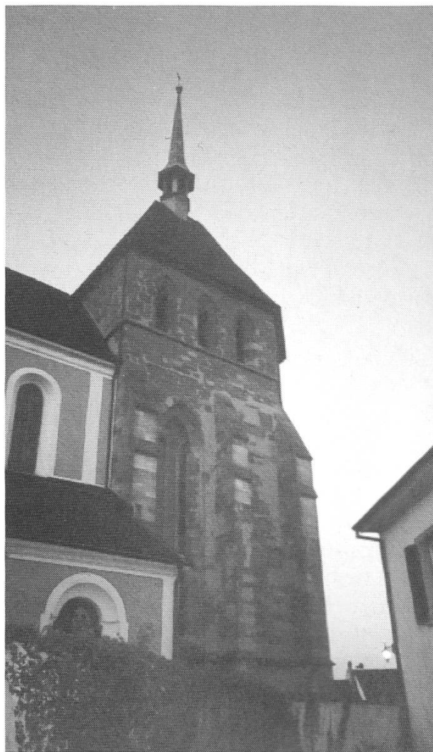
Das Zurzacher Verena-Stift im Abendlicht.

Der Basler Bischof ernannte im Jahre 2003 die heilige Verena zur Copatronin des Bistums Basel, um «einem heute besonders wichtig gewordenen Zeichen der Zeit, nämlich der Wahrnehmung der gleichen Würde von Mann und Frau, zu entsprechen». 232 Ernennungen von Copatroninnen und Copatronen kamen in der Kirchengeschichte immer wieder vor. So stellte man einem «Kirchen-Patron einen der Zeitmode mehr entsprechenden oder aus anderen Gründen beliebteren Copatron oder patronus secundarius an die Seite.» 233 Die «Migrantin» Verena entspricht vielleicht eher unserer Zeit als die tatsächlich etwas ausser Mode gekommenen «Legionäre» Urs und Viktor. In seiner kurzen Würdigung der Heiligen sagte der Bischof, die Glaubenszeugin Verena «habe sich durch Frömmigkeit und Caritas ausgezeichnet». 234 Beide Tugenden, vor allem die tätige Nächstenliebe, wur-