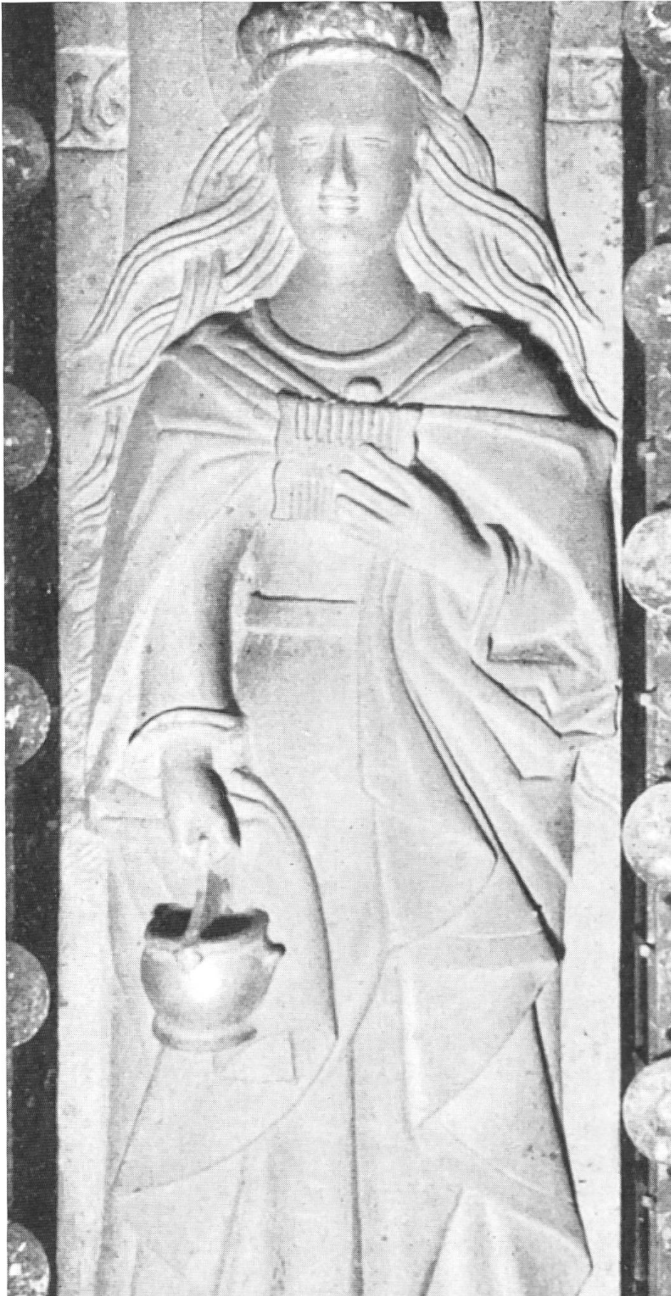
Grabplatte des Verena-Sarkophags in der Krypta der Stiftskirche Zurzach.