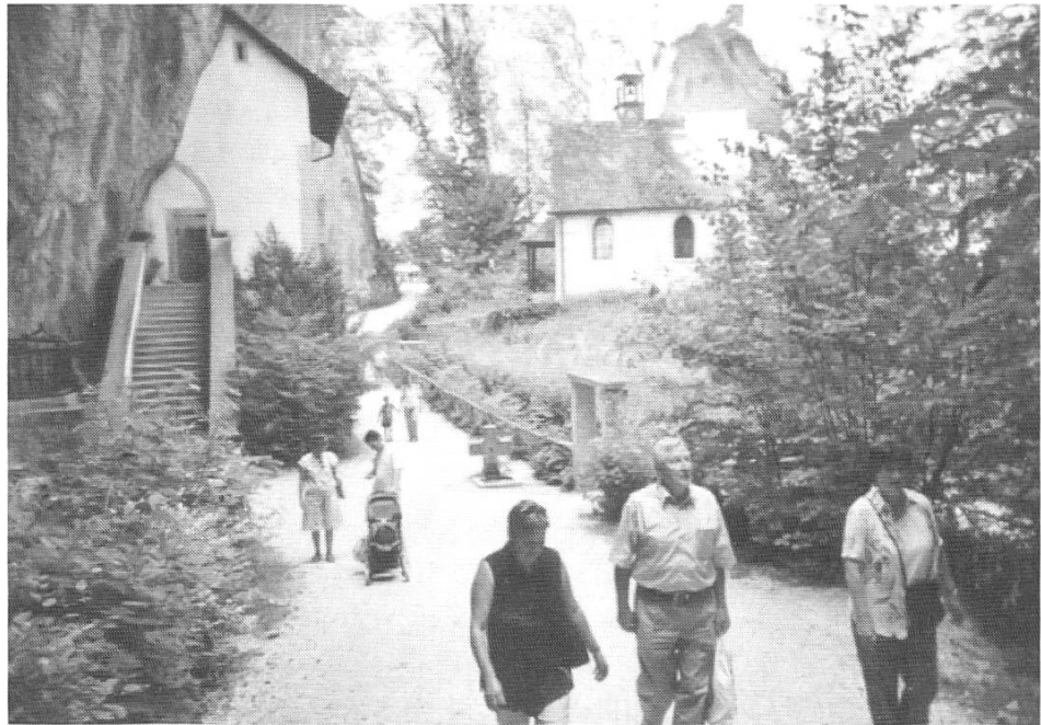
Die Verena-Schlucht bei Solothurn.

starke Sehnsucht nach Gott. 106 Während dieses Motiv in der Verena-Vita erst am Schluss auftaucht, steht es in der Benedikts-Vita am Anfang. 107