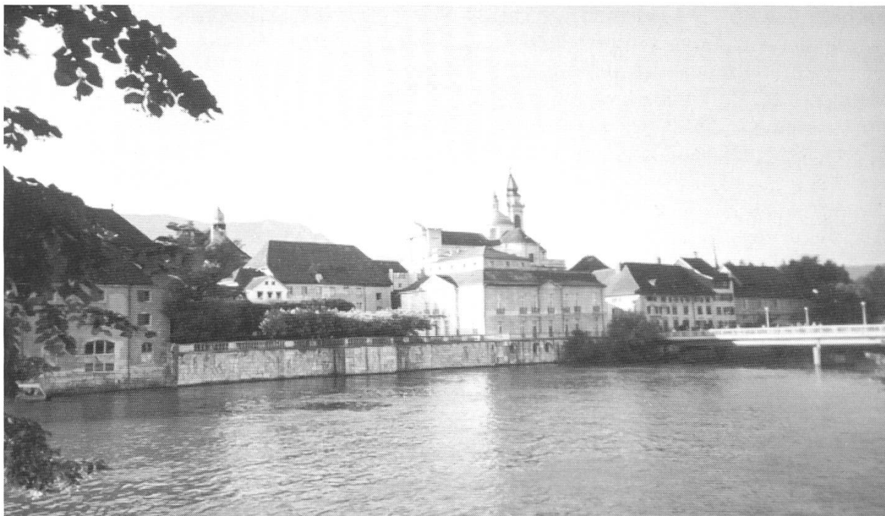
Ansicht von Solothurn. (Photo: D. Wunderlin, 2003).

nehmen. 48 Dem hätten sich die christlichen Soldaten unter den Legionären widersetzt. Daraufhin seien sie mitsamt ihrem Anführer hingerichtet worden. Historisch nachweisen lässt sich lediglich, dass der erste bekannte Bischof Theodor 49 von Octodurum (= Martigny) zu Ehren einer Märtyrergruppe in Agaunum eine Kapelle errichten liess. 50 Eine weitere Schwierigkeit besteht darin, dass es im Umfeld der Thebäerlegende zwei Männer namens Viktor gibt: Derjenige, der in Agaunum das Martyrium erlitt, war ein ortsansässiger Mann, 51 der Legionär