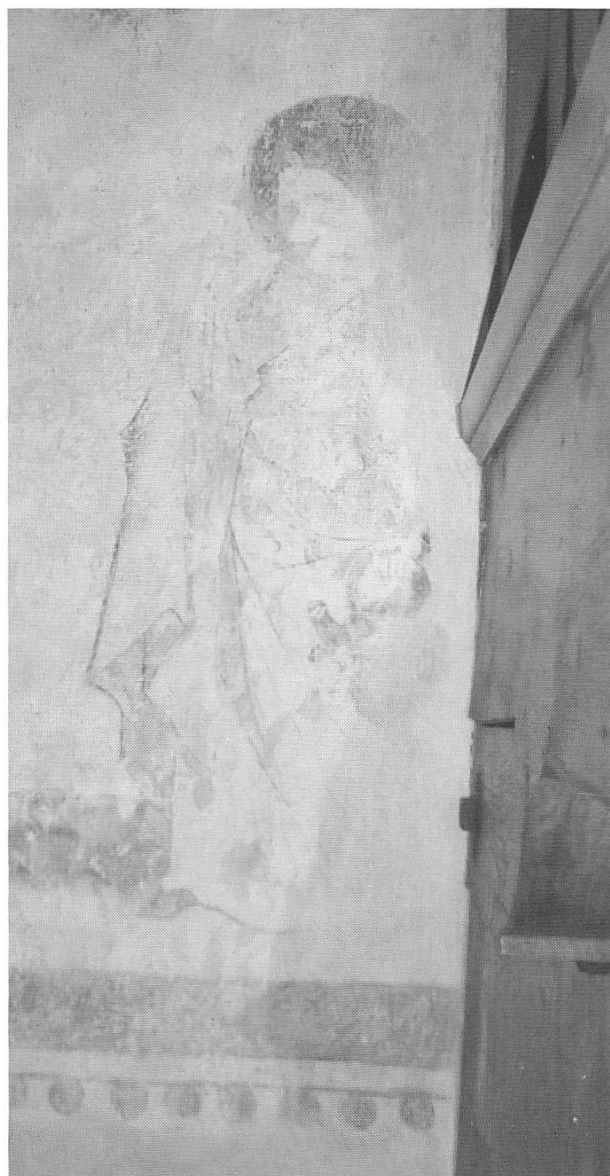
Die heilige Verena auf der Westwand des Kirchenschiffs, St. Nikolaus, Oltingen. Fresko, spätes 15. Jh.

dürften hygienische und sittliche Argumente gewesen sein. Auch in der Einsiedelei St. Verena bei Solothurn wandten/wenden sich kinderlose und ledige Frauen an Verena. 75 Beim nördlichen Treppenaufgang der St. Verena-Kapelle befindet sich ein handgrosses Loch im Felsen, in welches die Bittenden «mit gläubigem Sinn» ihre Hand hineinhalten können. 76 Verena habe sich an dieser Stelle in Ertrinkungsgefahr festgeklammert, als sie der Bach aufgrund eines Hochwassers wegzureissen drohte. Es wären noch weitere Beispiele zu nennen, die eine Verbindung der Heiligen mit Wasserquellen und Brunnen sichtbar machen. 77 Es sei an dieser Stelle nur noch auf das «Verena-Wasser» in Oltingen hingewiesen. Es entsprang gegenüber der alten Badquelle. 78 In der örtlichen Pfarrkirche erinnert ein spätgotisches Fresko (15. Jh.) an der Westwand des Schiffs an die heilige Verena. 79