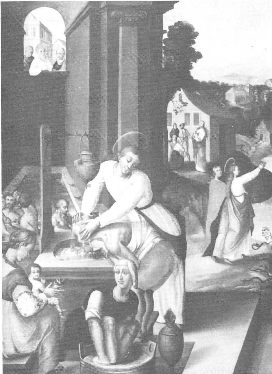
Verena pflegt Kranke, Blinde und Lahme und vertreibt Schlangen. Wandbild aus dem Zyklus im Verena-Münster Zurzach, geschaffen 1610 von Caspar Letter, Zug, unter Mitwirkung von Melchior Waldkirch, Zurzach.