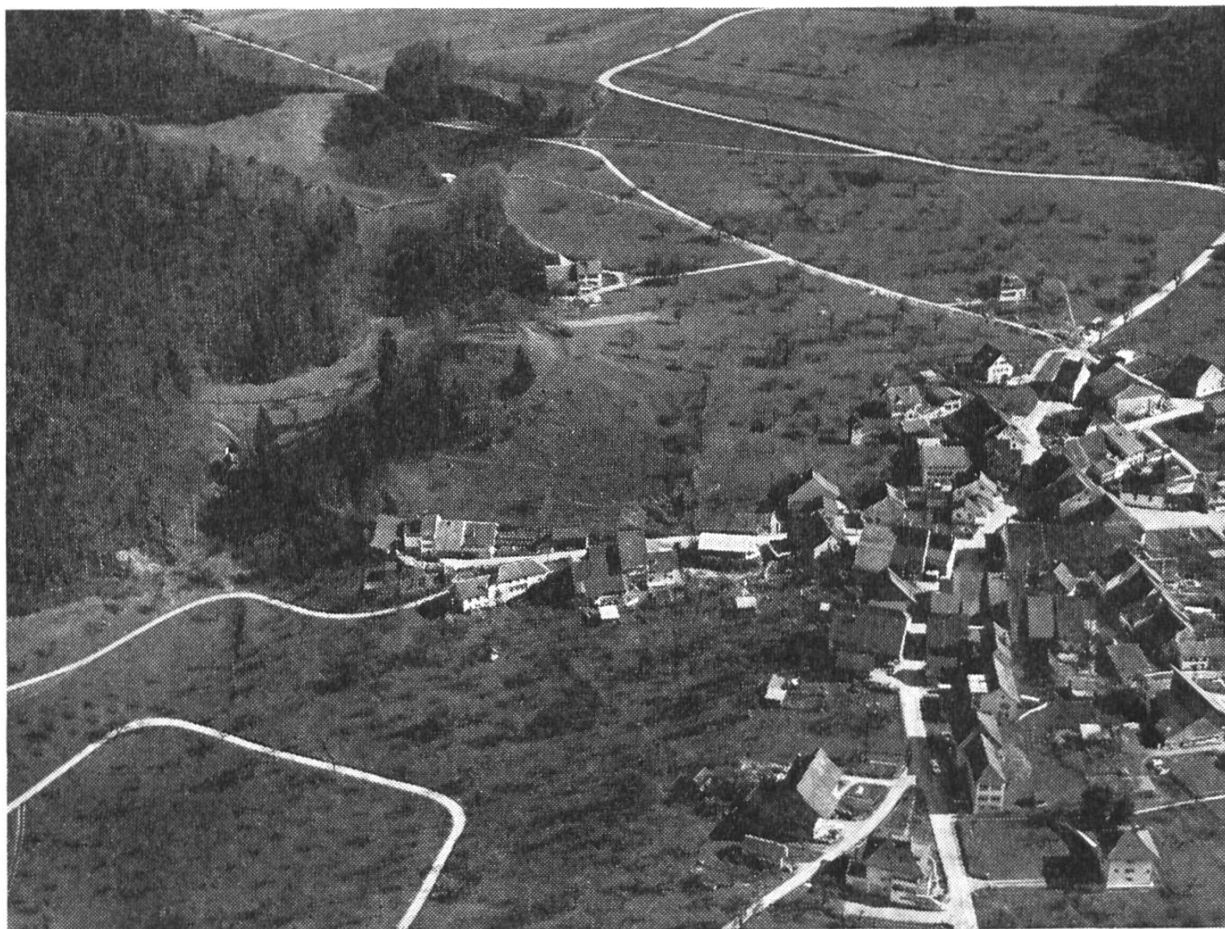
Titterten, von Nordwesten Landeskarte 1 : 25 000, Blatt 1088

Photo Ch. Tomek, Nr. 477 Aufnahmedatum: 15. 4. 1964, 15.30 Uhr