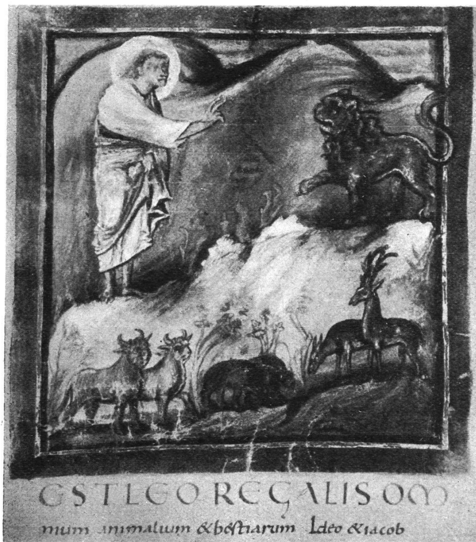
Cod. Bern. 318, fol. 7 a .

malade. Personnage dévêtu jusqu'à mi-corps étendu sur une couche de forme antique; la calandre est perchée au pied de la couche, tournée vers le malade qui tend vers elle ses bras. La draperie de la couche est peinte en bleu-ardoise; le sol est brun-jaune, le fond verdâtre. Dans le coin de gauche, vestiges de végétation. Une moitié de la peinture est effacée.