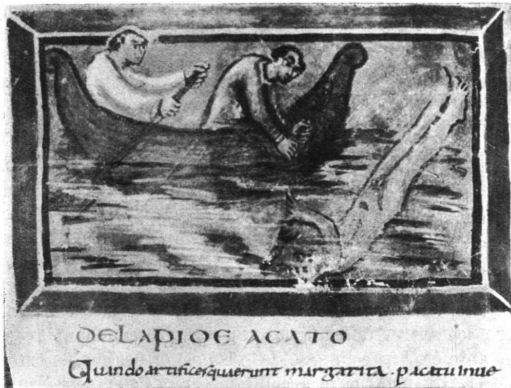
Cod. Bern. 318, fol. 20 b .

moy. — Hérisson volant des raisins. Tout le champ de la peinture est occupé par les volutes d'une vigne dont les rinceaux bruns et le feuillage et les fruits vert-jaunes se détachent sur un fond bleu-noir. Trois hérissons, de couleur grise, sont répartis dans différents coins de la peinture; l'un, monté sur la vigne, en fait choir les grappes, un autre détale emportant les grains empalés à ses piquants. Le traitement de la vigne est tout conventionnel, et rappelle par la symétrie de ses volutes les treilles symboliques qui tapissent le fond des mosaïques absidales de certaines basiliques anciennes, telle S. Clemente à Rome. — Mauvaise conservation; détails indistincts.