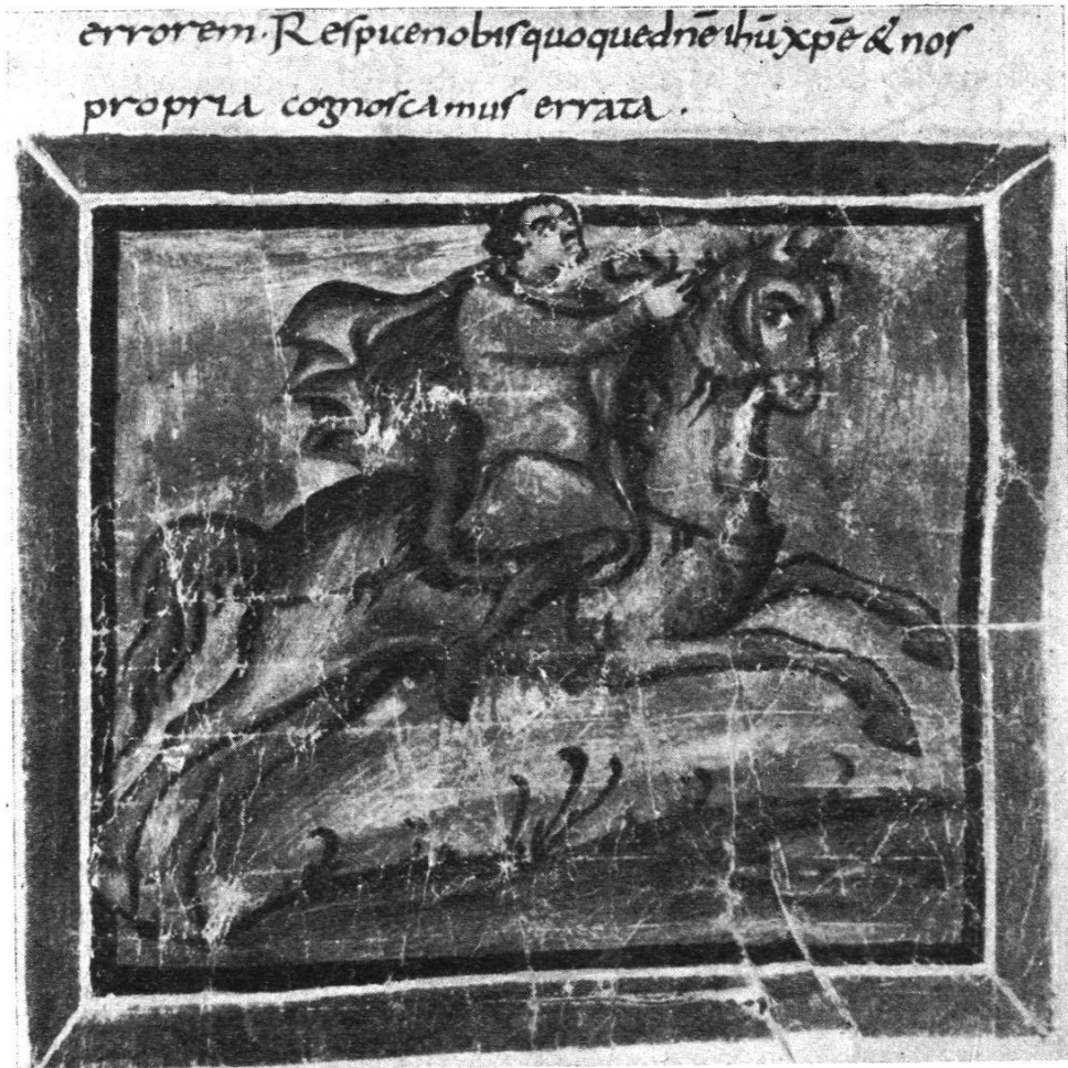
Cod. Bern. 318, fol. 22 a .

et attestent une extrême négligence d'exécution. Nous rencontrons ici une nouvelle forme d'arbre, une tige noire surmontée de trois feuilles lancéolées, également noires. Conservation médiocre.