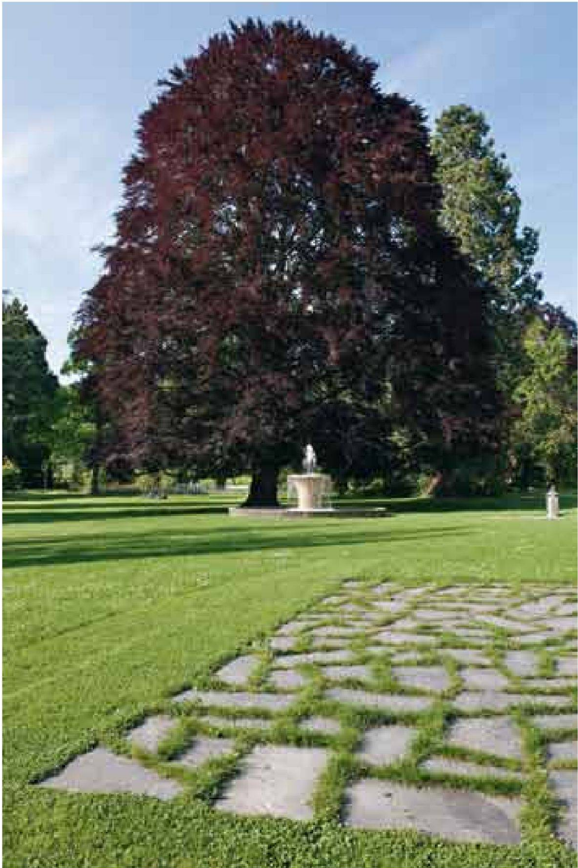
Blutbuche ( Fagus sylvatica purpurea ).