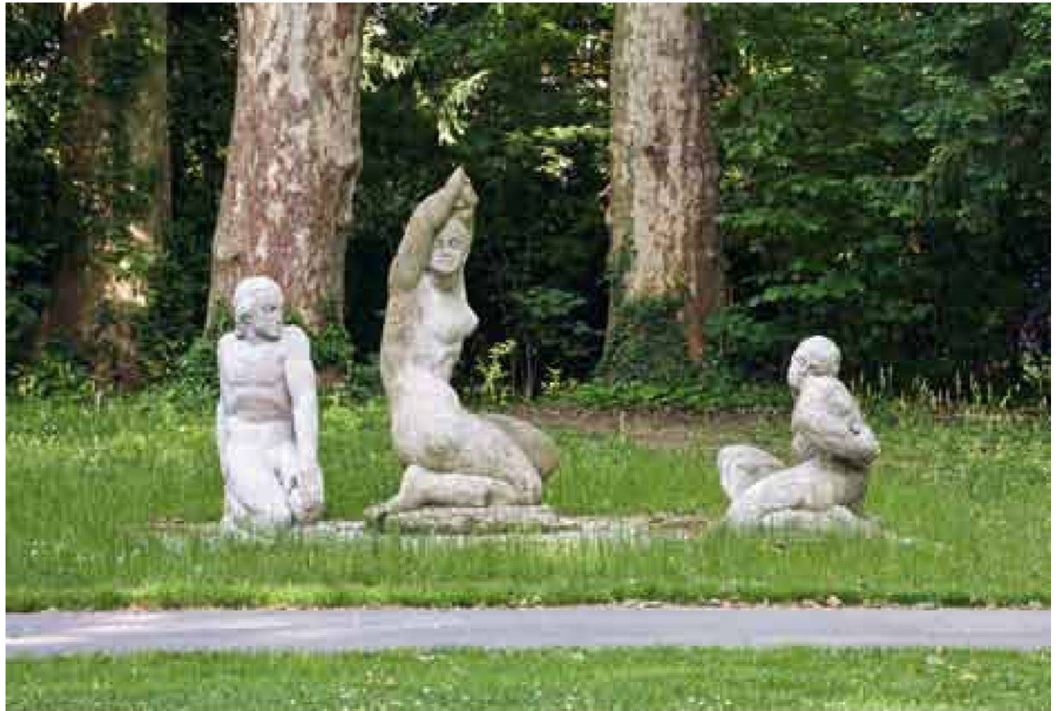
Figurengruppe von Hans Trudel: Narkissos 1935, Das Erwachen 1938, Der Verwundete 1936.