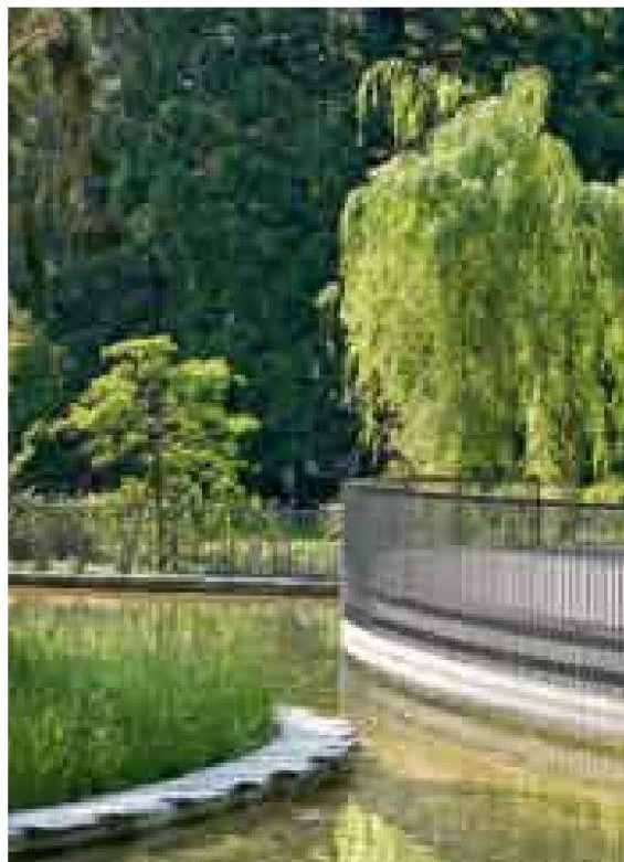
Känzeli mit Blätterdach. Zugangswege zum Park. Neue Teichanlage.